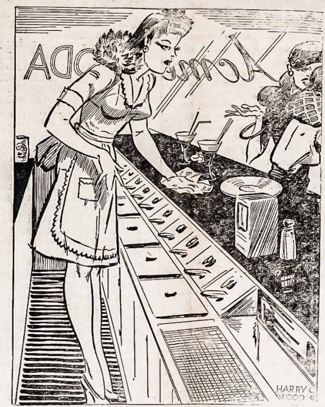
Magdukė sako: "Mano G. I. Juozas apvalys Pacifiką nuo japonų geriau negu aš galiu apvalyti šitą stalą, jei pirksite Karo Bonus jį remti."