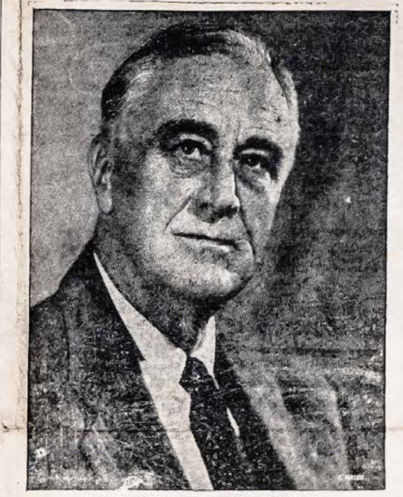
FRANKLIN DELANO ROOSEVELT PERRINKTAS IŠ V. PREZIDENTĄ KETVIRTAM TERMINUI

Gen. Ivan D. Černiakhovskio trečioji Baltosios Rusijos armija stovi 95 mylių fronte nuo 15 iki 20 mylių Rytų Prusijos gilumoj jau kelinta savaitė ir vokiečiai sužinojo, kad jis prižadėjo atnaujinti savo ofensyvą sekančiose keliose dienose. Maskvos komunistai pranešė tiksliai vietinius mušius Rytų Prusijoje, nuo tada, kada Černiakhovskio jėgos sutiko smarkiausią karo opoziciją, kada jie veržėsi į Karaliaučių. Mušiai už Budapeštą eina gatvėse. Maršalas Rodion Malinovsky pergrupavo Antrąją Ukrainijos Armiją dėl galutinio užpuolimo ant Vengrijos sostinės, per kur atsidarys kelias į pačią Vokietiją.