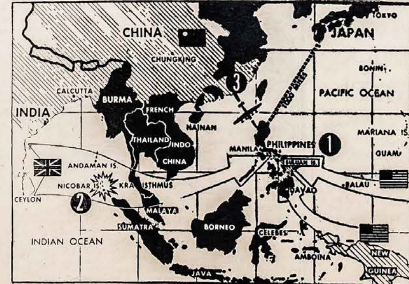
ARČIAU JAPONIJOS New York — Alijantai traukiasi arčiau Japonijos iš visų pusių: 1. Jungtinių Valstijų jėgos užėmė Leyte Salas ir ten steigia stovyklas ir aerodromus, 2. alijantų išoriniai ir iš jūrų atakos ant Nicobar salų Indian vandenyne, kurios paskutinės prieš įsi veržimą ant Singapore ir Malauja; 3. prieš įsiveržimo atakos ant Formosa.

Šiauliuose per kautynes žu- vo 4,700 civilių lietuvių. U- tena, Zarasai ir Rokiškis yra visiškai sunaikinti. Vi- si gyventojai iš Leliunų, Ma- lėtų ir Daugų ištremti Ru- sijon. Deportacija yra va- roma plačioje skalėje ir ki- tose vietose. Sovietai paskelbė nelegale mobilizaciją vyrų, Lietuvos piliiečių, gimusių nuo 1909 iki 1926 metų. Prieš šį netei- sėtą okupantų veiksmą, Vy- riausias Lietuvos Išlaisvini- mo Komitetas išleido protes- tą. Vyriausias Lietuvos Išlais- vinimo Komitetas vėl akty- viai pradėjo veikti, praneša žinios iš Lietuvos.