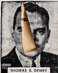
THOMAS E. DEWEY

Veda kovą už mažų tautų ir mažumų teises