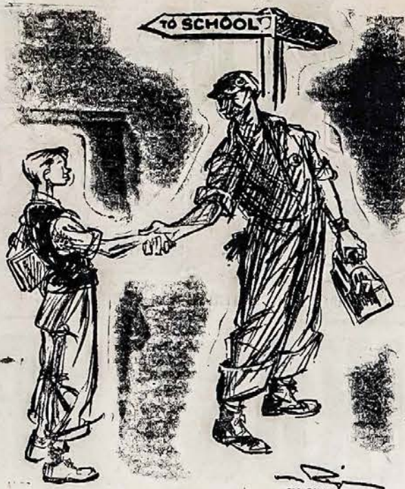
"ACIU JUMS UZ PAGELBA VASARMETY. TIKIU, KAD JUS ATEITY, MOKYKLA BAIGUS, DAR GERIAU GALESITE DARBUS NUDIRBTI."

Jeigu nebutų tas žodis "Fašistai" taip plačiai tarpe lietuvių išgarsėjęs ir jeigu nebutų "Dirva" ir "Vienybė" laikraščiai, tai "Lietuvių žinios" pasiūstų grynai tusčius puslapius savo skaitytojams. Lietuvių žinių redaktorius elgėsi panašiai kaip advokatai kada stoja teisme apginti savo klientą. Jie vieni kitą išsikoliaja, išsiburnoja, bet tai tik prie kliento akių. Privačiai, jie yra geriausi draugai. Bet ar laikraštinkam pritinka naudoti burnojimo metodą? Jūs patys į tai atsakykite. Iš šalies žiūrint, ramiais laikais gal toki išsireiškimai sukeltų daug intereso. O gal ir daug juokų, neatšizvelgiant su kokia intencija jos pateiktos, bet dabar kada mūsų visa tauta paplūkus asarose, varge, skurde ir kada mu-