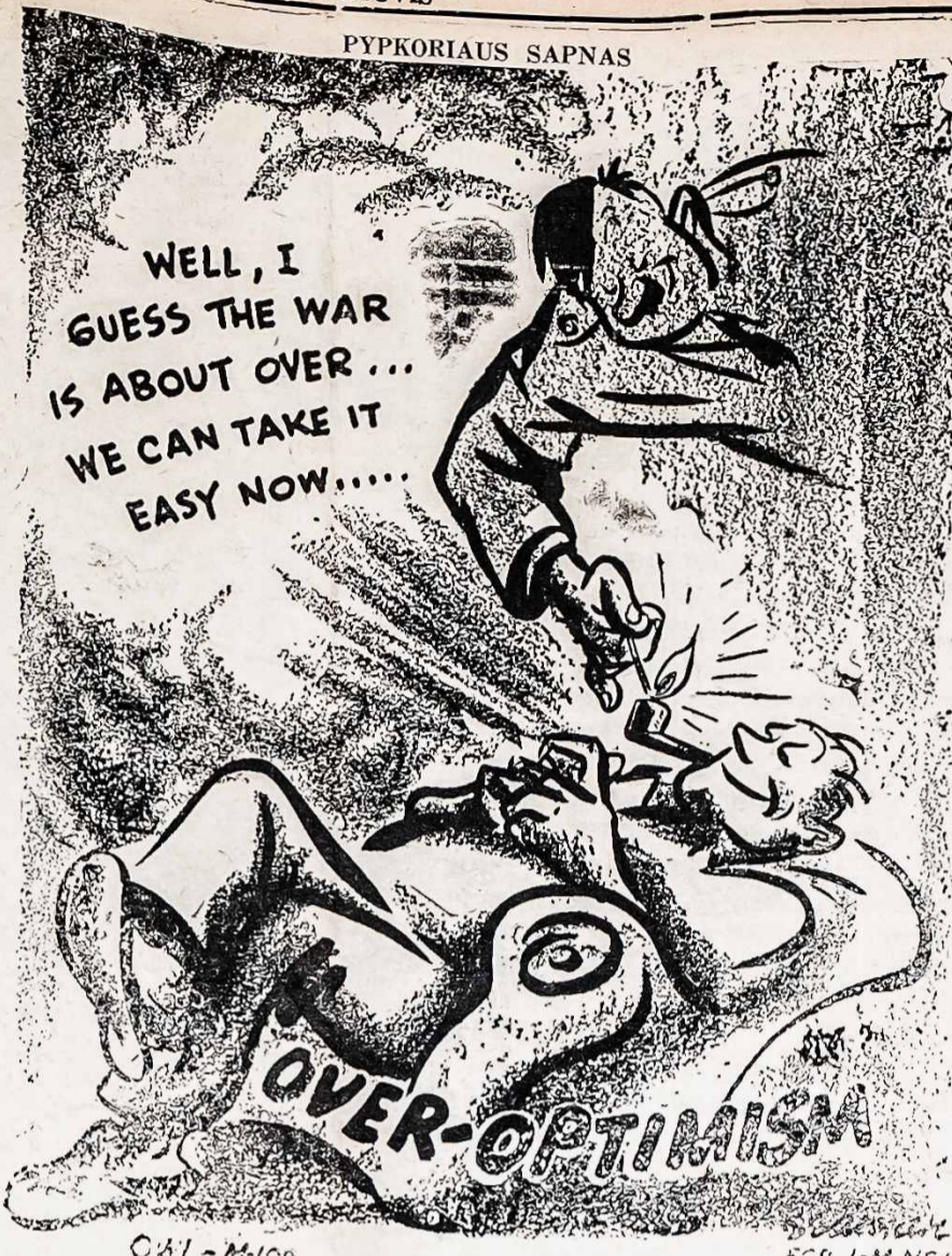
WELL, AŠ MANAU KAD KARAS KAIP IR UZBAIGTAS... DABAR JAU GALIM LENGVAU ATSIKVIPTI.

Relief atstovas. Jeigu mūsų fondo atstovai ir nuvyks į Lietuvą, jie nieko ten negalės nuveikti, nes bus budriai inkavendistų saugomi ir be jų žinios negalės niekur ir nosies iškišti.