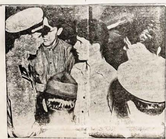
NACIŲ SUBMARINŲ VIRSININKAS SUIMTAS Washington, D.C. — Jo submarinas buvo nuskandintas Pakraščio Sargų naikintuvo, tai jaunas vokiečių povandeninio laivo viršininkas buvo suimtas. Šiame paveiksle, jaunas 26 metų naciis kalbasi su amerikony Laivyno karininku. Naciis prisipažino, kad gyveno Californijojej devynis metus.