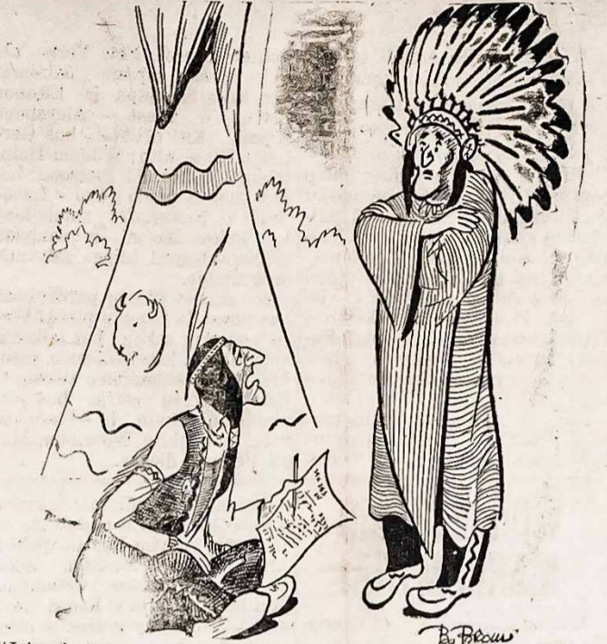
„Jeigu butumem laukę iki dabar parduoti Manhattan (New York miesto) baltaveidžiams, įsivaizdink kiek Karo Bonų butumem galęję nusipirkti!“

riuose susirinkimuose, pasiunčiame šios šalies valdininkams, ir visuomenės vadams, mes Lietuvai nepriklausomybės neatgausime ir neužtikrinsime. Tas mūsų pasiryžimas siekti prie savistovio, nepriklausomo gyvenimo ir egzistuoti, kaip gyvai tautai, pasaulio tautų šeimoje, turi mumyse pasireikšti ryžtingomis pastangomis išlaikyti šioje šalyje savo tautišku žymę — kalbą. Antras mūsų pasiryžimas turėtų but pakilti ekonominiai, kad mes butume žinomi pasauliui, kaip sumanių biznierių; ekonomistų tauta; o ne ubagų; skurdžių; nes su skurdžiais ne kas labai nori skaityties. Trečia mes turėtume dėti ryžtingų pastangų įsigyti visose gyvenimo srytse sumanių ir kompetentiškų mokslo žmonių. Pavyzdin mes turim gražią, idealę vietoj lietuvišką kolegiją. Tačiau liudna girdėt, kad iš 40, ateinančiam mokslo sezonui užsiregistravusių studentų, tik septyni yra lietuviai. Reikia mes lietuviai įsteigėme kolegiją ne sau, bet kitataučiams. Čia yra keblus ir nesuprantamas klausimas. Tą klausimą turėtų išaiškinti ir surasti ir jį tinkamą atsakymą. Pats kolegijos fakultetas turėtų pasiūlyti, nors į didesnes kolonijas kalbėtojus, kurie susirinkimuose išaiškintų kolegijos veiklą ir ant vietos iširtų, kokios priežastys sulauko lietuvius nuo leidimo savo vaikų savon kolegijon. S. Bugnaitis