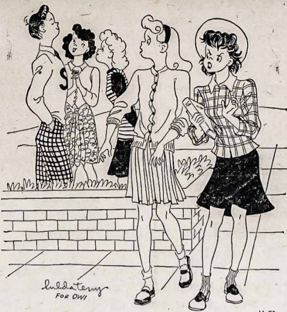
"Aš nežinau kodėl jos apie jį taip suka. — Ar nematai kiek piktžolių jis turi savo Pergalės Darže,"

"Nors daugumas darbų liejy- lose yra atliekami neįmanoma- me karšty," sakė McNutt, tačiau tai vis ne taip blogai kaip mu- škos jėgoms kai kuriose Paci- fiko salose. Liejyklų darbas sunkus, bet vyrai kurie šluože krantus Prancūzijos vykdo dar sunkesni darbai. Jeigu mūsų ka- reiviams bus tiek kiek jiems rei- kia lėktuvų, tankų, trokų ir šautuvų, turi susirasti daugiau liejykloms bei kalvinėm.