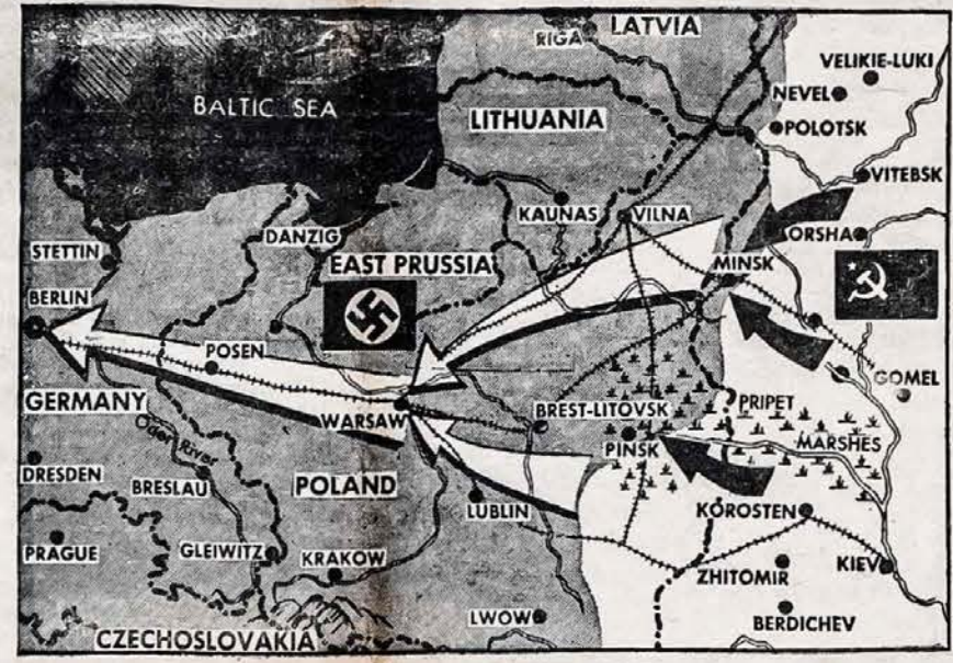
“DRANG NACH OSTEN” ATBULAI Sovietų Armijos žygis pradėtas sykiu su alijantų įsiveržimą į vakarinę Europą, privedė rusus kasdien arčiau Berlyno. Minskas papuolė rusų rankas birželio 29-tą, Vilnius, birželio 16-tą, paskui Kaunas ir dalis Latvijos. Apie 300,000 vokiečių nespėjo išbėgti ir pagauti, nes visi kėliai, apskaiteliai per girias ir pelkes, uždaryti.

London, liepos 8-tą — Raudonoji Armija daužė Rytų Prusijos sienas ir sunkūs mušiai tesėsi aštuonias mylias nuo rubežii. Toli į pietus, Rusai pasiekė Lvovą, žemesnėje Lenkijoje ir su tankais pradėjo užpuolimą ant miesto. Rusų armija žengia pirmyn septyniuose frontuose. Vokiečių radio sakė, kad rusų armijos kariniai pasiekė Augustavą, Suvalkuose.