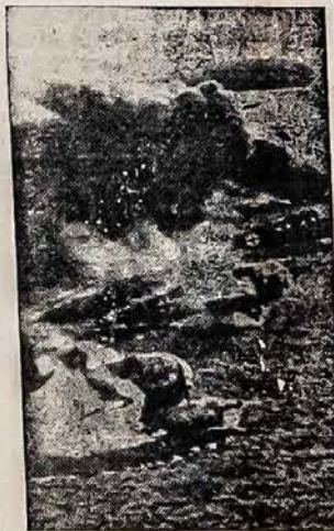
NACIŲ LĒKTUVAI DEGA Britanija. — šitas Suvienytų Valstijų A.A.F. paveikslas, rodo vokiečių lėktuvus degančius ant žemės, po Suv. Valstijų 8-tos Oro Jėgos atakos ant priešų aerodromo Europoje.

Išvieno, išvieno prie tėvynės gelbėjimo darbo! Jei nesutariam prie dabar esančių veikimo centrėlių, tai palikim juos, prie jų galėsime, jei norėsime, sugrįžti, kai atliksim dabartinį darbą, gyvąjį reikalą. Sueikim naujoj vietoj, naujomis mintimis, nauja nuotaika. O ta nuotaika turi būti visų vienoda — tėvynės gelbėjimo darbas! Atsišaukiu tad į visus ir visas! Ir į tą inteligentiją, kuri pirmiau ar vėliau atvyko iš Lietuvos, bet nedalyvauja veikime dėl to, kad nepatinka veikiančiųjų kai kur neaktvingumas. Išėikite iš to balasto. Tėvynės darbai turi būti už vis svarbiausi. Atsišaukiu į veikėjus, inteligentiją, profesionalus, kunigus! Musų tėvynė ištikta bado,