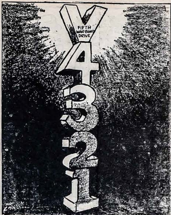
ŠIES DIENOS YRA SUSKAITYTOS!

Dabar sugrįšime prie vienybės klausimo. Vienybė, kaip ir taika, žodžiai magiški. Tačiau abu jie yra subordinuoti principui, skelbiamam, kad "salus rei publicae suprema lex esto" — "valstybės gerovė tebūnie aukščiausias įstatymas." Jis turime galvoje taikos atvejį, vietoje "valstybės" reiktų įdėti žodį "žmonijos". Eikime prie konkrečių pavyzdžių. Miuncheno konferencija buvo pasirašyta neva taikos obalsiu. Kas iš to išėjo, žinome. Dabar prie vienybės valstybės viduje klausimo. Grįžkime į 1921 m. Koalicinę socialistų-katalikų valdžią, nežinint Vilniaus užgrobimo, vis ieškojot kompromisų su lenkais. Nedaug betruko, kad ir Hymanso projektas būtų priimtas, o jei tai būtų įvykę, Lietuva būtų virtusi lenkų provincija. Tautininkai prieš tokią politiką griežtai protestavo, dėstė spaudoje Hymanso projekto žalą bei nurodė jo pavojus ir šiuo taip sujudino visą lietuvių tautą, kad ir pati koalicinė vyriausybė nebesidrįso toliau Hymanso projekto laikytis. Tik ką paduotame pavyzdyje vienybės nebuvo ir jos nebuvimas kaip tik išėjo Lietuvos naudai. Imkime dar kitą pavyzdį — 1926 m. Socialistų valdžią, beproteguodama mažumas