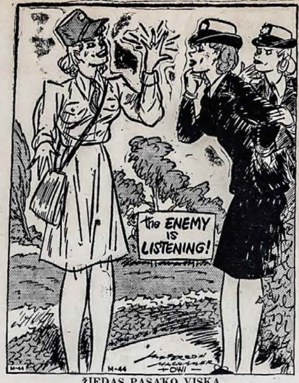
ŽIEDAS PASAKO VISKĄ

Sekdami Lietuvos ir Amerikos lietuvių srovinų vadų veiklą ir politiką renkame žinias atėičiai — istorijai iš Lietuvos Tragedijų. Ateis laikas, šios žinios iš dabarties bus labai daug pamokinančios ir pasakančios. Dieve duok, kad po karo Lietuva turėtų savo laisvą spaudą, kuri galėtų surašyti viską iš dabarties