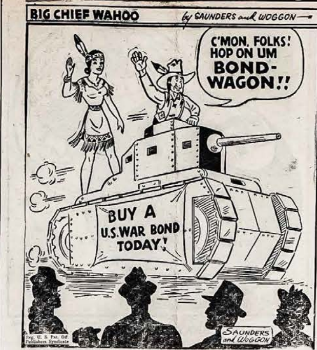
REMĖKIME PENKTOS PASKOLOS VAJŲ PIRKdami KARO BONUS

Kaip "Žmogaus teisių deklaracija" nebuvo naujos tiesos atradimas, o tik žmogaus sieloje glūdėjusio troškimo oficialus deklaravimas, taip ir Wilsono tautos asmenybės pripažinimas tebuvo istorinės tiesos—tiesos, dėl kurios milijonai žmonių sąmoningai jau apie šimtą metų kovojo—patvirtinimas. Tačiau nors asmens ir tautos teisės šiandien yra viešai paskelbtos tiesos, nors socialinis ir tautinis momentas tiek tarpvalstybiniam bendravime šiandien jau turi atitinkamą vietą, žmonija dar nėra pilnai įsisąmoninusi tų dviejų sąvokų reikšmės ir jų savitarpio santykio. O jei taip, tai kažin ar ir dabartinis bausis karas bus tinkama priemonė dar neišspręstoms problemoms išspręsti.