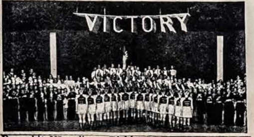
Paremkit Užpuolimą—Pirkite Daugiau Karo Bonų!