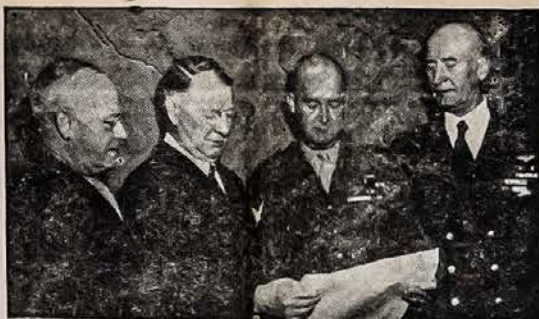
PIRMASIS PILNAS GENEROLAS MARINŲ ISTORIJOJ

Tautininkams teko spręsti klausimą, ar jų sveikų poli-