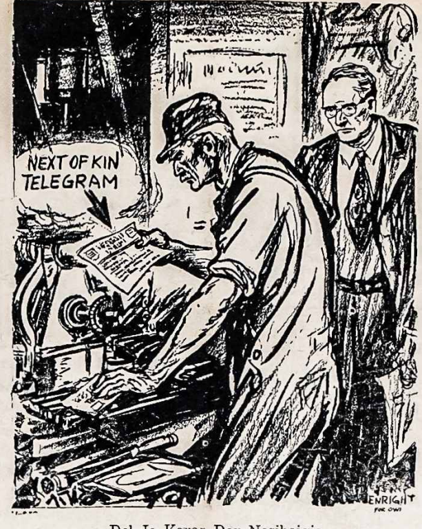
Del Jo Karas Dar Nesibaigia

Pirm. (pas.) Ig. Padvalskis - Sekr. (pas.) Gilydis Spec. Koresp. LIETUVIAI! SKAITYKIT IR PLATINKIT AMERIKOS LIETUVI! JAUČIATĖS BLOGAI? VISISKAI PALENGVINSITE SAU — SIUO MODERNISKU SVELNIU BUDU... KUOMET KANKINATIS VIDURIU UŽKLETĖJIMU — ŽARNOS NEVEIKTOS, SKAUDA GALVĖ, NĖRA ENERGIJOS — PALENGVINSITE SAU SIUO MODERNISKU BUDU — KRAMTYKITE FEEN-A-MINT. Ši skoninga kramtoma guma viduriu liuosuoja žemai ir tikrai. MHLJONAL! Šmonij! NAUDOJA FEEN-A-MINT. Tik pakramtykite FEEN-A-MINT šnant guld, naudokite tikrai pagal nurodymus ant pakelio. Sekanti rytė malonus palengvinimas pagelbės jums vėl jaustis puikiai.