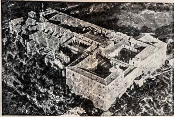
BOMBARDUOJA NACIUS IS CASSINO ŠVENTVIETĖS

Italija. — Kassino Kalno Monastyras, seniausias pasauly, kurį subombardavo Amerikos lakunai, kaip nacių tvirtovę iš kurios jie apšaudė Alijantus. Del Kassino ir šiandien tebeeina mirtina kavo tarpe ašies ir demokratijos gynėjų.