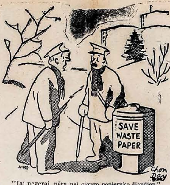
"Tai negerai, nėra nei cigaro popieruko šiandien."