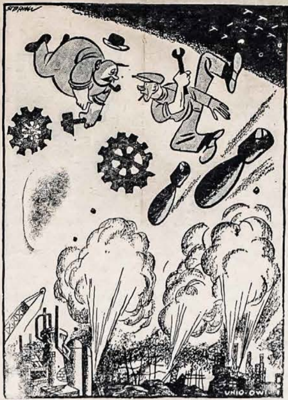
"Mes, Fritzai, neužilgo tapsime žemdirbystės valstybe"

Kad sutiktų tą artėjancią revoliuciją, mūsų šalies valdžia matomai turi mintyje kokią ten naują pokarinį socialio saugumo planą ir darbininkų unijų de-