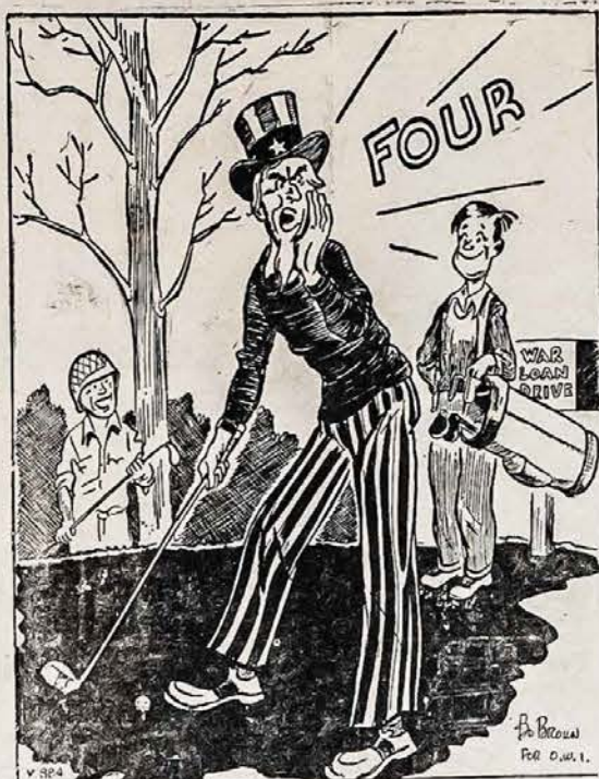
Pasistengkime Laimėti Ketvirtą Karo Paskolos Vajų

Jei ir musų amerikiečių lietuvių veikime, kaslink atstatymo savo tautos nepriklausomos valstybės nsimato to taip vadina- mo našumo, pasiryžimo, tai vien dėlto, kad mes suminkštėjome, kad mūmyse stoka savę atsizadėjimo, kad mums labiaus rupi savo gyvenimo saugumas. Apart savo medžiaginių reikalų aprupinimo — maisto, drabužių, jokių aukštesnių idealų mūmyse, kaip ir nebeapsireiškia. Proto