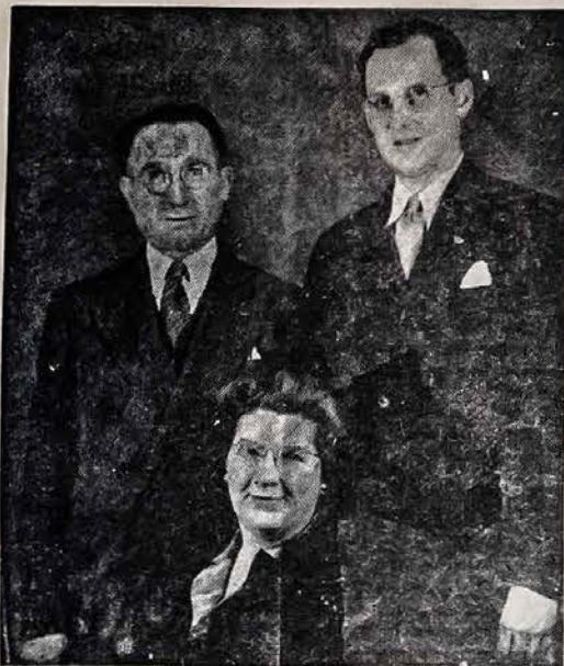
BONŲ PARDAVIMO DIENA IR LIETUVOS NEPRIKLAUSOMYBĖS SUKAKTUVIŲ MINĖJIMAS.