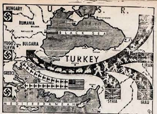
Šis žemėlapis parodo, ko Hitleris gali susilaukti iš kariaujančių tautų pusės Balkanuose šiame pavasaryje.

Tenka pažymėti faktą, kad tautininkų, Lietuvai Vadovų S-gos ir American Friends of Lithuania vadai laimėję yra, kad numatė šiam Seimui šį momentą. Šis tautinės pasauliaziūros Amerikos lietuvių Seimas įvyko 5 ir 6 dienomis vasario, kuomet Sovietų Rusija paskelbė Molotovo lupomis Stalino siūlomą reformas, butent: visoms sovietiškomis, jų pavergtoms tautoms "placios laisvės" autonomijas. Tai buvo labai svarbus momentas, kuriame Amerikos Lietuvių Seimas savo nutarimais, peticijomis Amerikos Prezidentui Rooseveltui ir tiems pareigūnams Suvietų Tautų pasisakė, kad žinodamas Lietuvos žmo-