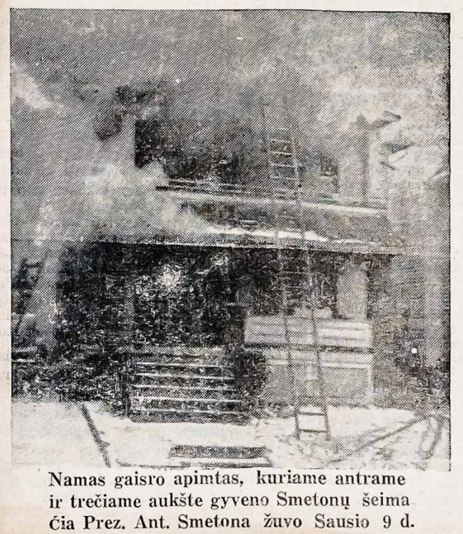
Namas gaisro apimtas, kuriame antrame ir trečiame aukšte gyveno Smetonų šeima. Čia Prez. Ant. Smetona žuvo Sausio 9 d.

Mūs kraujo broliai lietuvių komunistai nori, kad rusai komunistai Lietuvą valdytų, kitų srovių lietuvių sako, kad jie nori, kad kunigai, arba, socialistai, arba tautininkai Lietuvą valdytų. Visų jų yra vienodi pareiškimai. Bet būtų geriau, jeigu lietuvių komunistai ir kitų srovių lietuvių pasisakytų, kad mes norime savo kraštą patys valdyti demokratiškai, kad visoms partijoms ir įdėjoms laisvę būtų patikrinta nepriklausomoj Lietuvoje. Jeigu jie taip protautų, tai nebutų politinių partijų vergus, jie šiame momente susikaupytų ir vieniną rūpintųsi patikrinti laisvę lietuvių tautai, nepriklausomybę Lietuvai, geresnius santykius su Maskva ir Vatikanu ir savo tarpe politiniam ir ukiniam gyvenime bei visuomeniškam darbui. Bet tokios sąvokos nėra pas mūsų partinius vadus ir jųjų pasekėjus,