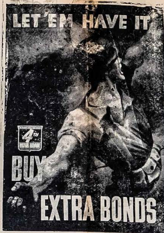
4-TOS PASKOLOS VAJUS