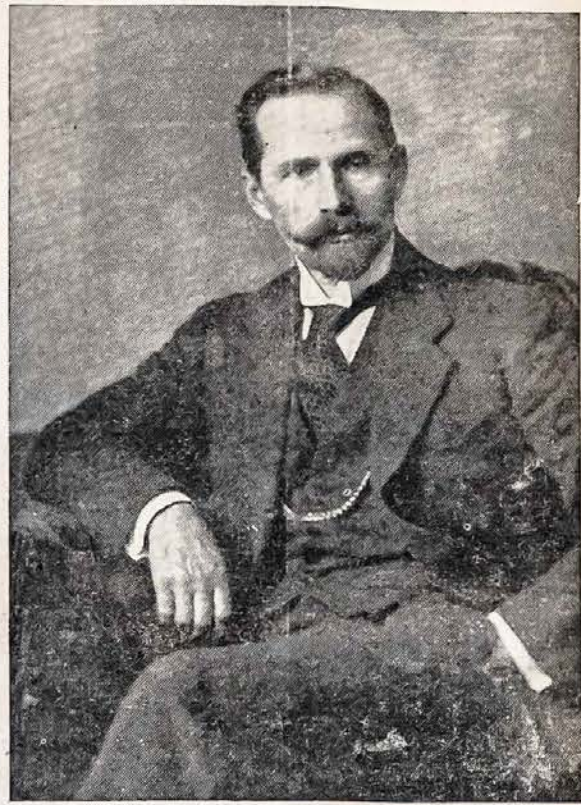
A. A. Pirmutinis Lietuvos Prezidentas Antanas Smetona

AMERIKOS LIETUVIS 14 Vernon St. Worcester