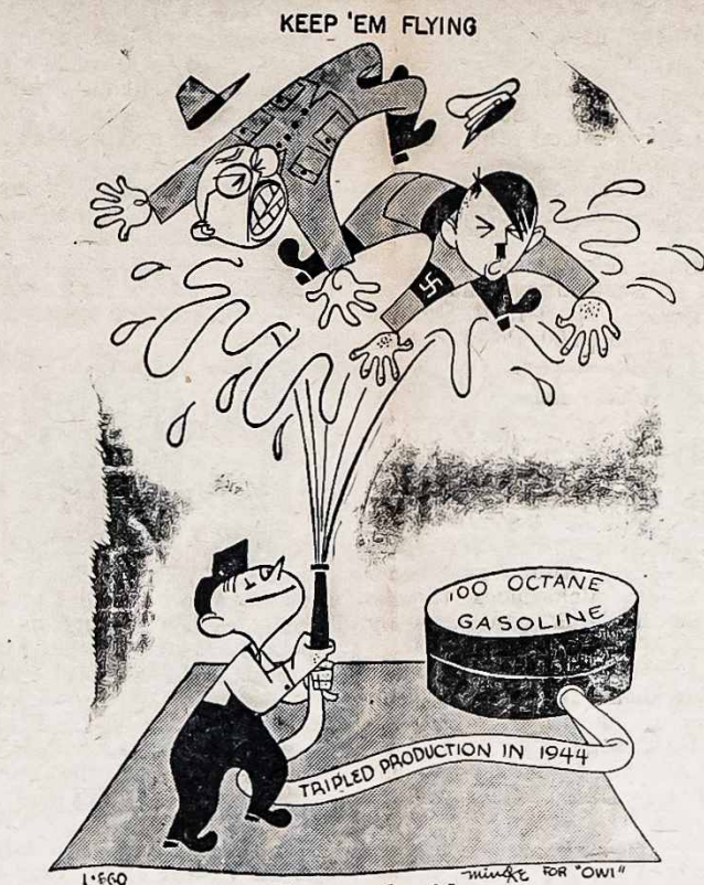
Te sau skraido

kurie nesuprastų, jog, bedievy- bės idėja yra mus tautai mirtin- nai kenksminga, o visgi tačiau- randasi žmonių, kurie tikėjimą ir krikščionybės mokslą vadina ir laiko proto tamsumo prie- tarais; kurie patys sau įsivaizdi- na ir kitiems skelbia, kad tikėjimas stabdo proto vystymosi progre- są. Kokia tai nesąmonė! Labiaus nuostabu, kad tokias nesąmones reiškia žmonės, kurie laiko savę neva apsišvietusiais, moky- tais. Bedieviškai protaujant iš- eitių taip, kad išgelbėti skęstan- tį žmogų, arba ligos, nelaimės išstiktam žmogui, suteikt kokią nors pagelbą butų stabdymas proto vystymosi progreso. Ga- na. Pakanka jau mums tokios kvaivos, bedieviškos filozofijos! Tiesiog nesuprantama, kaip gali sveiko proto žmogus taip sapa- rtauti. Tad, gal ne be reikalo šv. Raštą bedievius vadina “be- pročiai.” Dabar, nors trumpai į klausi- mą: ar ištikrųjų tikėjimas stab- do proto vystymosi progresą Sakysime: puslėtomis ranko- mis, šurkštus, bemokslis žvejis Simonas — Petras, įtikėjęs į Kristų, likęs Jo mokiniu, lieka išmintinguo mokytoju, garbingu, garsiu visam pasauly orato-