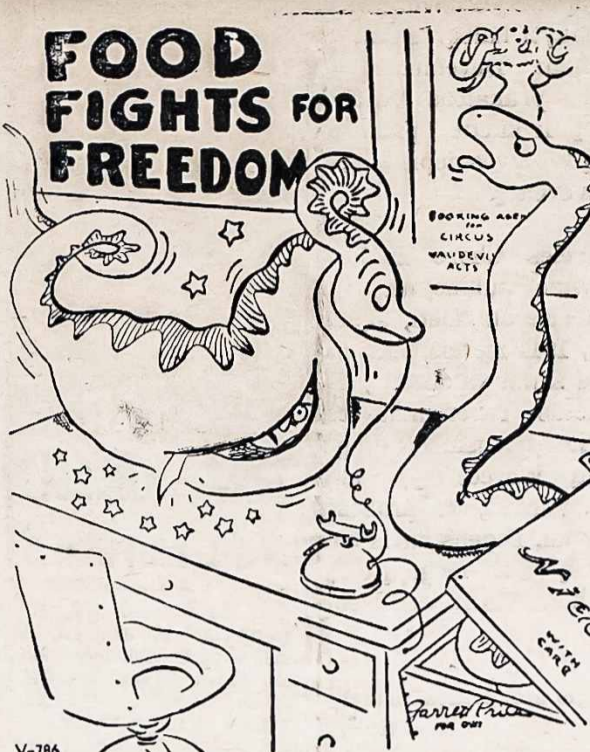
MAISTAS KOVOJA UŽ LAISVĘ

Kodėl už mus lietuvius kaip neu- žtaria? Ir netik kad nežtaria, bet dar išėina viešumon, kaip teko neseniai pastebėti "News- week" žurnale, kur tulas Moley skelbia nesamones apie mus lie- tuvius, kad buk mes lietuvių niekad neegzistavę kaip atskira tauta, priskaito mus prie slavų ir kitokių nesamonių apie mus pripiepa. Atsakymas aiškus, už- tada, kad žino jog mus moralės jėgos yra silpnos; kad mes vieni kitų nekenčiame, nesame vieni- gi, kad tarp mus eina nuolati- niai kivirčiai; kad mes neturime rimtų gilaus mokslo žmonių, o jei