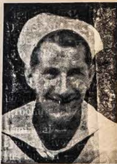
JONO PETRO KVARATIEJAUS LIKIMAS NEZINOMAS

(Antanas Duda, Sav.) 12 Ashmont Ave. Tel. 2-5336 Worcester, Mass.