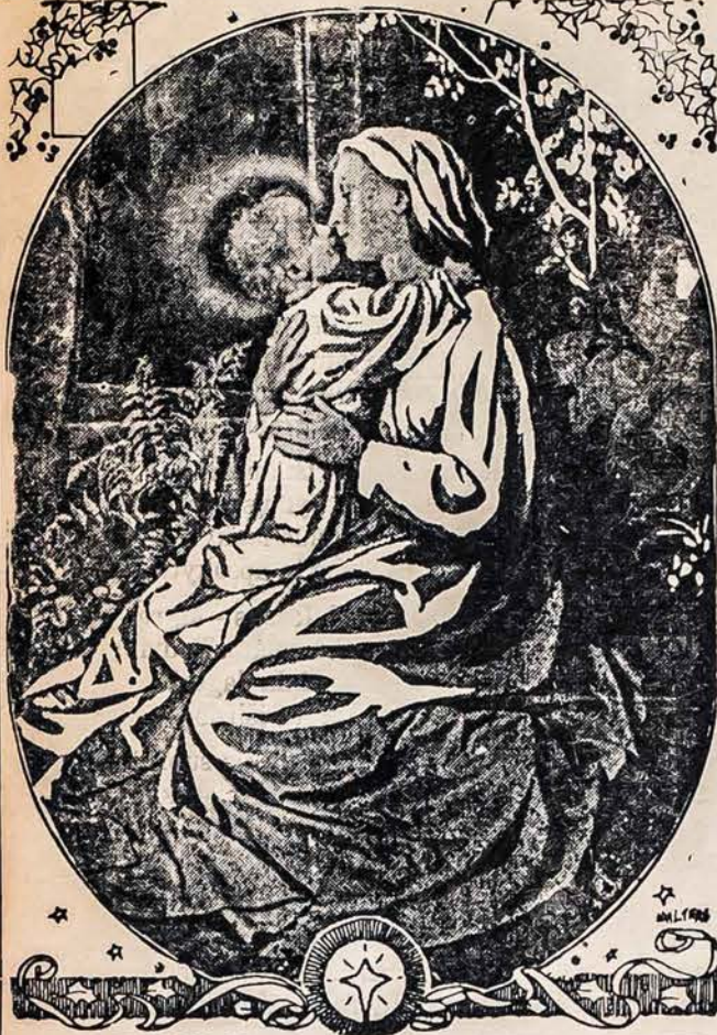
KALĖDOS - KRISTAUS GIMIMO ŠVENTE

pauperizing Bolshevistic system against the will of the people, and looted, plundered its money, warehouses, stores, co-operatives and educational institutes and museums; murdered, imprisoned, exiled its leading men, women and children for no other reason save that they refused to subscribe to Soviet System; and