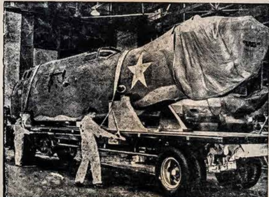
STATO NAUJĄ BOMBIERĮ šis paveikslas paimtas vidų Vakarinio Pakraščio orlaivių statymo dirbtuvės rodo didelį Fruehauf "Trailer" su bombiero dalimi, kuri jau gatava pasiųsti prie kitos darbininkų grupės.