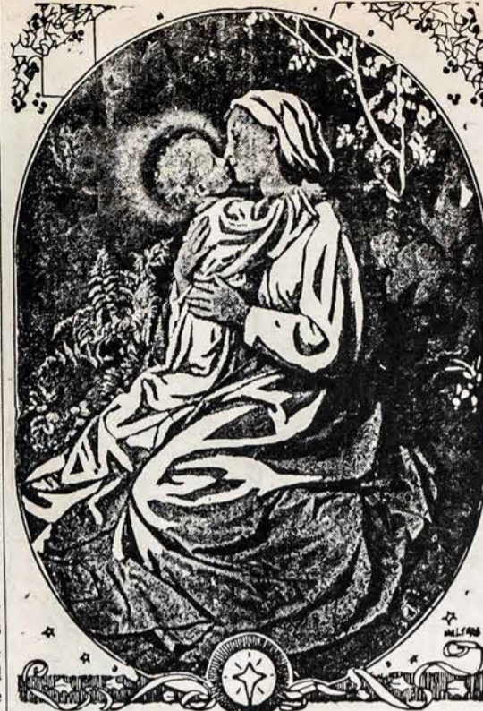
KALĖDOS — KRISTAUS GIMIMO SVENTĖ

Dievas nepadaro intervencijos ir nesulaiko skerdynių karo? Galima jiems atsakyti, kad Dievas davė žmonėms savo įsakymus. Kristus tuos įsakymus visiems suprantamais pavyzdžiais išaiškino. Bet jei žmonės tų įsakymų nepildo ir surengia skerdynes, tai ne Dievas, bet patys žmonės delto kenčia. Bet atteis laikas, kada Dievas padarys žmonijai viešą teismą ir kiekvienam sulys jo darbų atlyginis. Šiuomi baigiu savo rašinį, linkėdamas visiem šio laikraščio skaitytojams linksmų Kalėdų švenčių. S. Bugnaitis