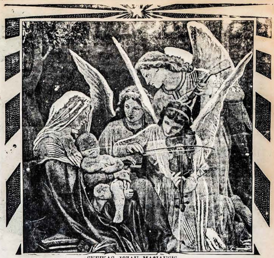
SVEIKAS JEZAU MAŽIAUSIS...

Metai slinko greitai. Daug kartų buvo galima sutikti Artabaną Egipte, Betlėjuje, ir apeliukėje. Jis gelbėjo pavergėliams. Jisai gyveno miestuose, kur kildavo epidemijos ir išgelbėjo daug žmonių nuo mirties. Jisai sušelpė kalinius, išlaisvino belaisvius, ir pagelbėjo našliams. Savo gyvenimo kelionėje jisai nesutiko Karalių, bet rado daug žmonių, kurie nuo jo pagelbos laukė. Taip begyvendamas sulaukė senatvės. Jau praėjo tris-