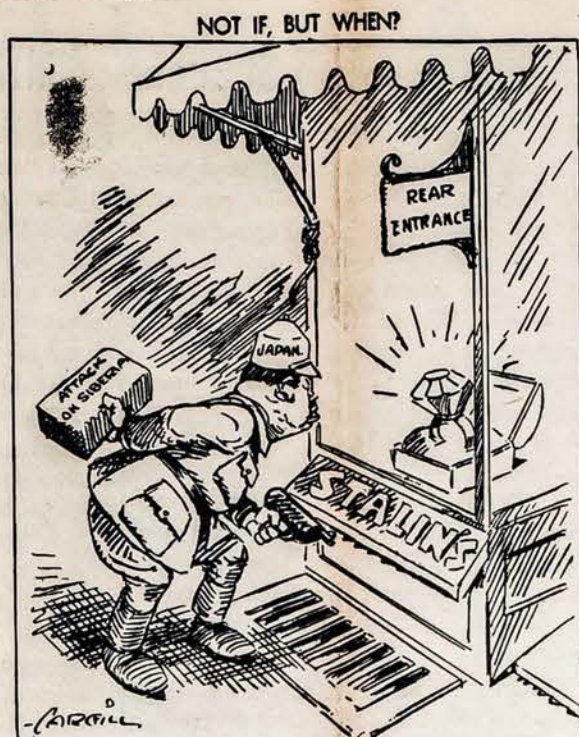
JEI NE DABAR, TAI KADA GALĖSIU BRIAUTIS PAS STALINĄ PER UZPAKALINES DURIS?

Dar baisesnį išgyvenimą turėjo viena šeima Lusakoje. Kartą jauna mergaitė, vos beatgaudama kvapą, atbėgo į policijos nuovadą ir vos prakalbėdama ėmė verkėti ir skūstis. Ji pasokojo, kaip ji, motina, tėvas ir sesutė išvykę į kitą stovyklą, į vestuves. Jie turėję nukeliauti penkiasdešimt mylių į šiaurę, tačiau pakelyje atsitikusi baimė nelaimė. Užėjusi naktis ir jie turėję nakvoti. Jokia baimė jų neėmusi, nes niekas nebuvęs pasakojęs, kad tose vietose siaučia plėšrūs žvėrys. Vidurnaktį staiga pabudusi motina ir išgirdusi baimingą mirtiną tėvo šauksmą. Jos akyse liutas jis sudrakė. Motina skubiai ėmusi budinti dukteris ir liepusi lipti į medžius, tačiau jaunesnioji taip stipriai buvusi įmigusi, kad ne taip lengvai pavykė ją pabudinti. Tuo tarpu sugrįžęs liutas ir čia pat sudrakęs motiną ir penkių metų mergaitę. Baisią tėvų ir sesutės mirtį puikiausiai matė mergaitė, kuri spėjo įlipti į medį. Po to liutai buvo apsupę ir tą medį, kuriame buvo pasislėpusi nužudytųjų duktė. Taip mergaitė tekę kėsti alkį ir troškulį net dvi dienas, kol žvėrys galutinai pasitraukė.