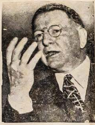
STOVĖJO UŽ 40 VALANDŲ SAVAITE

Po seimui aš gavau apie porą šimtų laišku nuo kuopų viršininkų ir senų, nuosirdžių Susivienijimo veikėjų. Laiškai rimtai ir nuosėkliai tą tarimą analizuoja, daro patarimus, persta padėti kuopose ir nekuriu narių išteklius, ir prašo manęs ir Pildomosios Tarybos reikalą taip sutvarkyti, kad tas seimo tari-