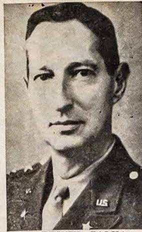
KAREIVIŲ GALVA ANGLIJOJ