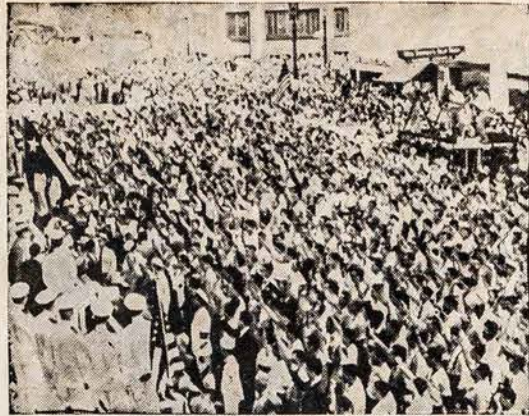
ATKERSYS UZ 1,000 VYRU MIRTIS