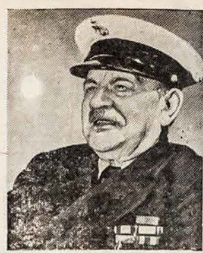
80 METŲ SENIS STOJA KARIUOMENĖN

Leitenantas generalas D. D. Eisenhower, visų Amerikos jėgų komandierius Europos karo teatre, paskelbė kad majoras generalas M. V. Clark (viršuj) buvo paskirtas kareivių vadas Anglijoje.