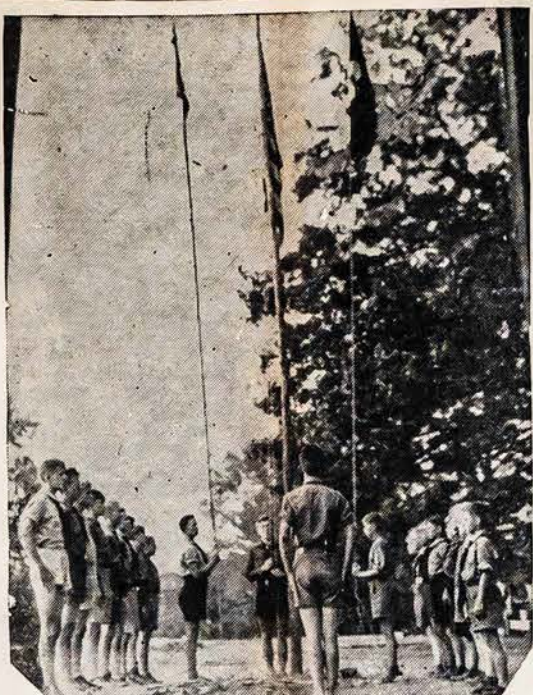
KAIP "BUNDAS" MANKŠTINO SAVO JAUNIMĄ

"Galutinai, neturime užmirš- ti prisidėjimą svetur gimusių pi-