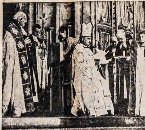
NAUJAS ARKIVYSKUPAS Canterbury Katedroj, Anglijoje, Dr. William Temple, pirmą kartą sėdi šv. Augustino kedėje, kada jįsai formaliskai tapo Canterbury arkivyskupas. Jįsai užima Dr. Cosmo Gordon vietą, kaip Anglikonų bažnyčios galva. Kairėje yra Dr. Hewlett Johnson, Canterbury dekanas.

"Pagalvokime apie ateitį. Pasekime momentui sovietiską protavimą ir sutikime, kad Baltijos valstybių ir Suomijos terito-