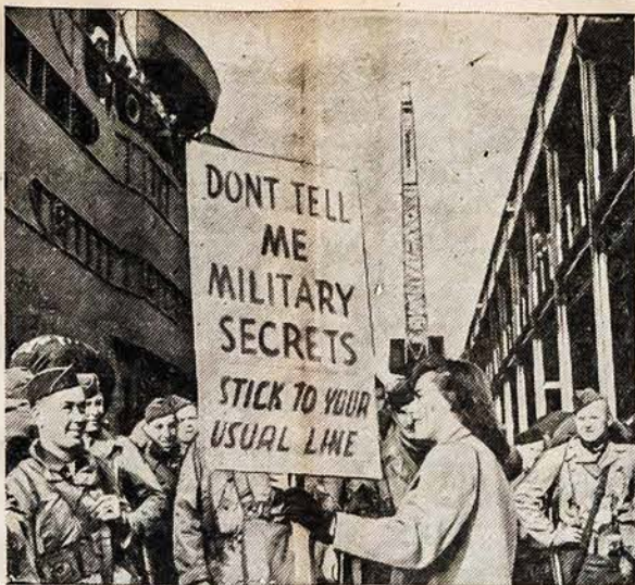
PATARIMAS AMERIKOS KAREIVIAMS AUSTRALIJOS Šioji australietė mergina sutiko Amerikos kareivių būrelį, kurie išlipo iš savo transporto, kur nors Philipinų salose. Amerikos kareiviai ir Australijos merginos turi apie daug reikalų pasitart.

Ne. Čia nepragaras, o tik cirkas. Jie budami maskuoti, nusugando mano tyro šėšelio, ir viešai iškėlė klausimą, kad mane iš cirko be bolševikiško "bilieto" išmesti. Bet prievarta išvesti neišdrįso, o aš pati neišėjau. Iš čia patiektų minčių, lai skaitytojas pats sprendžia, kas buvo tas lietuviškų ruskių vadinas "kongresas" - pragaras ar cirkas?