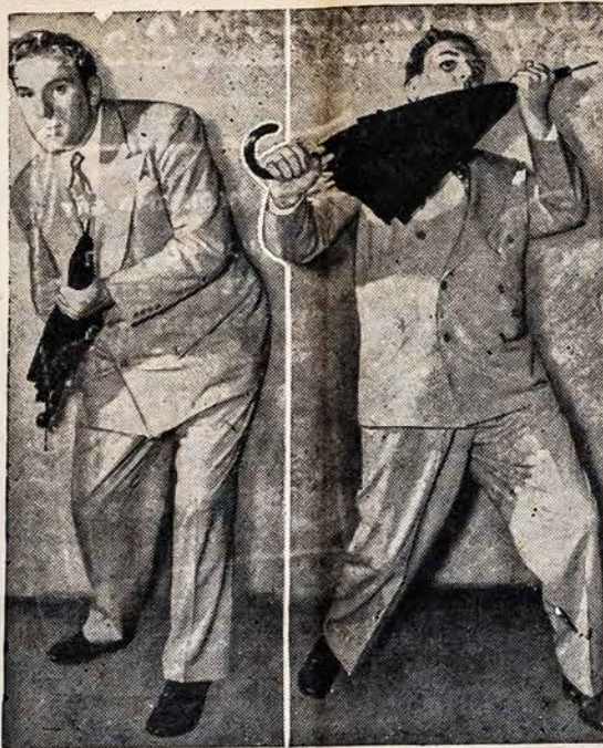
RODO CIVILIO APSIGYNIMO ŠPONA