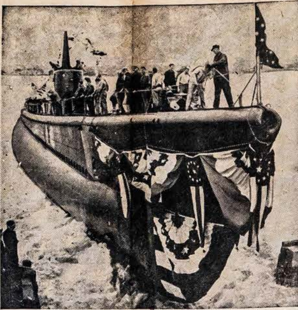
NAUJAS SUBMARINAS. Ašiai bus daugiau bėdos kada šitas J. V. submarinas pradės veikti. Šitas naujas povandeninis kovotojas buvo pavadintas Gurnard. Submarinas pirmiausia bus išbandytas vandenyse, paskui pradės savo veikimą prieš Ašį.

Tokiu būdu A. Smetonos, kaip Tarybos pirmininko, paskum kaip prezidento, vadovaujama Lietuva buvo privesta prie demokratiškai rinktos krašto atstovybės.