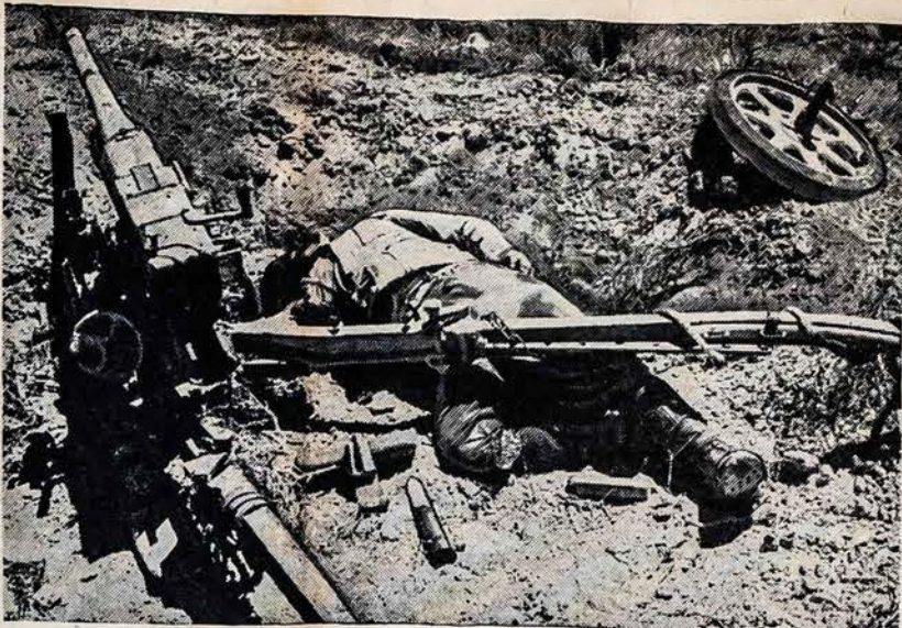
ITALO ARTILERISTO GARBINGOS KELIONĖS GALAS Gulėdamas šalia savo pabuklo liekanas, šitas italas artileristas užbaigė savo gyvybę bekovodamas prieš britų tanką. Jo namiškiam bus pasiūstas užuojautos laiškas nuo Mussolini, vienas iš daug, kiek pasiūsta per paskutines kelias savaites po smarkaus mušio Afrikoje. Del artileristo tai "vie- ta saulėje" apie kurią Mussolini dažnai kalba iš balkonų pavėsyje.

Pastarųjų 25 metų bėgyje komunistiška ideologija ryškiai yra įrodžiusi savo CREDO. Komunistų politinė veikla, propa- ganda laike pastarųjų 25-kių metų užkorduota ir dabar pa- lieka negincinamu faktą, kuris kaip su pirštu rodo, kad KOMU- NISTAI IR NACIAI paraleliškai eina griovimo keliu, kad jiems rupi sugriauti demokra- tišką santvarką ir krikščionišką CIVILIZACIJĄ pasauly, pakeis- ti politinę, socialinę ir ekonomi- nę santvarką. Šių faktų iš savo raštų komunistai neišgirus ir nepaslėps, taiti dabar karu me- tu, komunistų apsimetimas "pa- trijotais," neįtikina mūsų, ne- pakeičia mūsų opinijos komu- nistų atžvilgiu, nes mes žinome, kad komunistų rodomas "patri- jotizmas" ne iš širdies ir pilie-