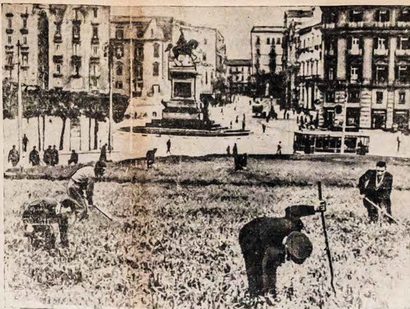
AUGINA KVIECIUS VIESOSE AIKŠTĖSE ITALŲ MIESTUOSE. Šioji fotografija, dar tik gauta iš Londono, buvo nutraukta, Naples, Italijoje. Rodo kaip darbininkai priūro kviečius, ten kur pirmiau augo gėlės, Piazza del Municipio, didžiausioje viešoje aikštėje tame mieste. Bado pavojui gresiant, kiekvienas žemės plotas yra išdirbtas ir naudojamas. Šių metų derlius yra daug menkesnis negu paprastai.

— Poznanėje atidaryti specialiniai kursai, kuriuose bus mokyti instruktoriai busią mokomi, kaip statyti trobesius iš molio. Esą, molio statyba esanti Rytuose "įprasta". Taip skelbia "Wilnaer Zeitung".