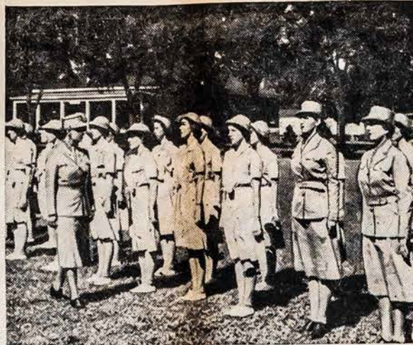
PIRMAS PATIKRINIMAS WAACS

Klausimas: — Mano vyras čionai gimė, 1892 metais. Kaip žmona Amerikos piliečio aš galiu prašyti antrų popierių be pirmų popierių. Mano vyras neturi gimimo sertifikata, nei kitų dokumentų kurie įrodyty jo Amerikos pilietybę. Ką turiu daryti? Atsakymas: — Jeigu jus vyras turi dvi senesnes gimines arba du draugu, kurie žino kur ir kada jis gimė, jų paprašykite pagaminti afideivitą. Kitaip, tamstai prisiėsis parašyti į Census Bureau, Washington, D. C. dėl informacijų apie vyro gimimą. Cenzos Biuras reikalau ne kurių informacijų apie vyrą ir jam pasiųs formą, kurią jis turės išpildyti. Kadangi tamstos vyras gimė 1892 m., tai gal 1900 arba 1910 m. gyventojų suskaičymas jį bus užrašęs ir galės pranešti kur jis gimė.