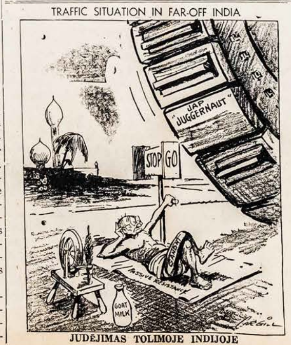
JUDEJIMAS TOLIMOJE INDIJOJE

cijos Bostona. Konferenci- ja, šaukiama New Yorko majoro La Guardia, J.V. Majorų konferencijos pir- mininko, bus laikoma Bos- tono Miesto Rotužėje 10-tą val. penktadienio ryte.