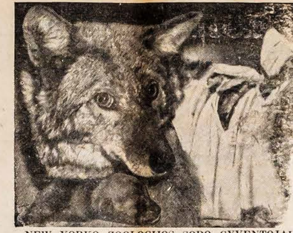
NEW YORKO ZOOLOGIJOS SODO GYVENTOJAI Bronx Zoologijos Sodo gyvulių ligoninėje, New Yorko mieste, buvo išgelbėta šių Amerikos vilkų šeimos gyvybės. Šiais metais pavasarį gimė daug įvairių gyvulių ir direktoriai delto džiaugiasi, nes iš priežasties karo, negalima gauti naujų gyvulių.