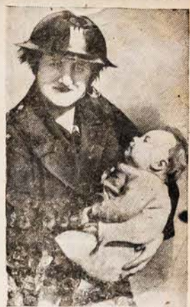
MIEGA PO UŽPUOLIMO Kairėje ant rankų moteris — globėja laiko miegantį kūdikį po išorinių antpuolių ant anglų miesto Morwick, kurį vokiečiai bombardavo del atkeršijimo anglams už RAF sprogdinimą Vokietijos pramonės centrų.

JUOKAI — Kam Dievas sutvėrė bulves? — Kad ir vargšai turėtų kam kailį lupti. — Ko tu teip nuliudes? — Ką-gi nebusiu nuliudes? mano šuva, kurį aš teip mylėjau, vakar pabėgo sykiu su mano pačia.