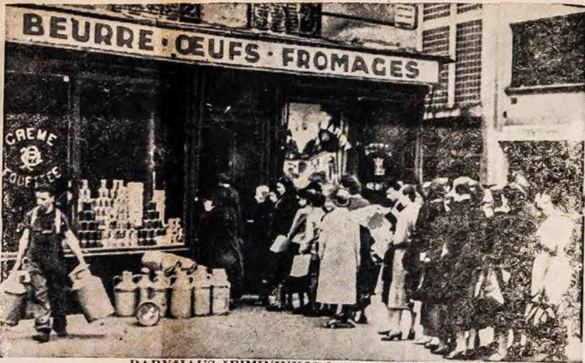
PARYZIAUS SEIMININKES LAUKIA MAISTO Po dviejų metų Hitlerio valdymo, šis paveikslas padarytas Paryžiuje, rodo prancūzų šeiminkes laukiančias del savo maisto. Nors krautuvė skelbia sviestą, surį ir kiaušinius, šios moterys negauna šių produktų. Skardinės sudėtos lange tuščios. Pienius nuneša tuščias pieno skardinės, kurias vo- kiekiai įsakė tenais laikyti.

Pastebėtina, kad rašant apie Zalgirio mūšį Vytauto vardas išleistas. Garbės priskiriama Jo- gailai, vadovavusiam lenkų ir lietuvių kariuomenėms,