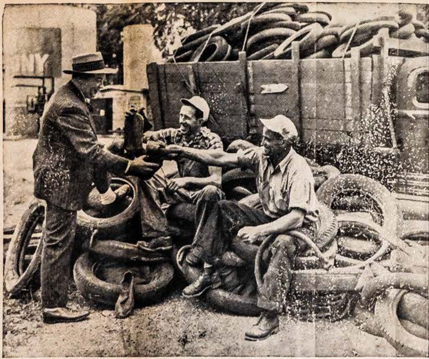
Farmers don't keep them down on the farm. Thousands of tons of rubber tires — originally bought by Massachusetts farmers for smudge purposes — are being turned in to gasoline filling stations throughout the state, as Bay State orchard men get behind the scrap rubber drive launched by President Roosevelt.