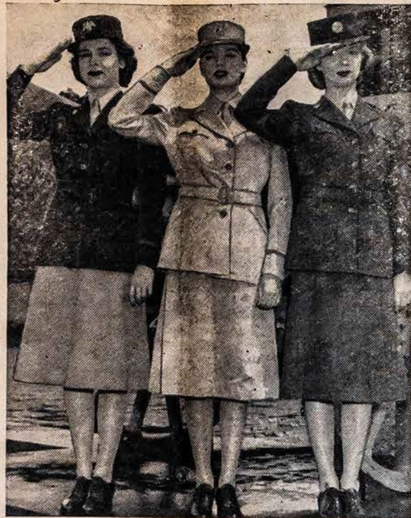
ČIA YRA WAAC KOSTIUMAI