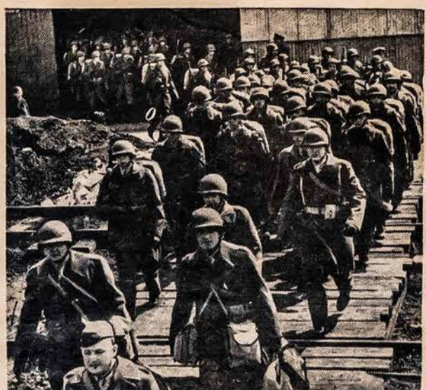
J. V. KARIAI AIRIJOJE... J. V. marinai pasiekė savo tvirtovės kur nors vakarinėje Airijoje po persėdimo iš vienos iš transportų. Tai buvo didžiausias A. E. F. kariuomenės skaičius perplaukt Atlantiną laike šio karo.