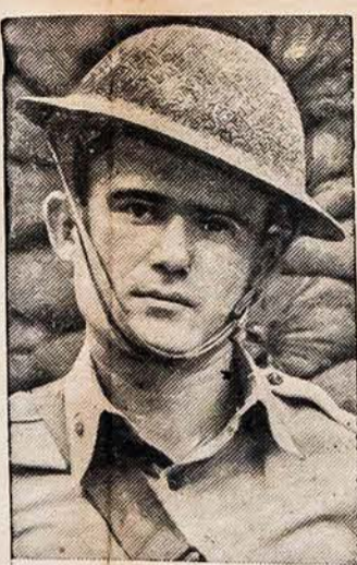
PASIEKĖ AUKŠČIAUSĮ LAIPSNĮ