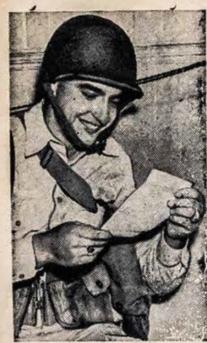
DZIAUGIASI GAVES LAISKĄ

Ir štai šiais metais, kovol-mą dieną buvo surengtos Worcesterio auditorijume prakalbos, del Lietuvos Prez. Antano Smetonos. Kaip pradėjome rengti prakalbas, tai atsirado Worcesteri net keli Justino Paleckio pasekėjai su vienu "Paručiku". Tie Paleckio klapčiukai, pirmiausia pasigamino peticiją ir rinko parašus ir vežė tuos parašus į New Britain, Conn. ir paskui dar į New Yorką, kad tik Lietuvos Prez. nevažiuotų į Worcesterį. Bet tiems Paleckio pakalikams labai nesi-sekė, jie bėgo ant draugijų susirinkimų ir bendrai su komunistais putė į vieną dūdą, kad kaip nors sustabdžius tą Prez. maršrutą. Dabar kyla klausimas, ar galima tokius žmones skaityti lietuviams? Toki žmones yra tikri Justo Paleckio klapčiukai. Atvykęs į Worces-