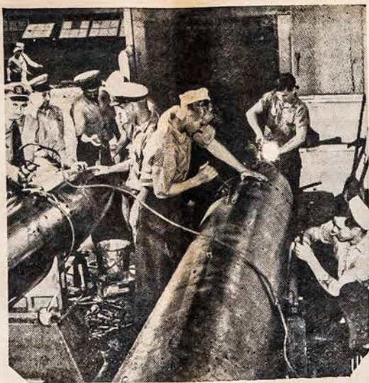
RUOSIA DOVANAS JAPONAM

Ar nebutų gerai, kad Naujoje Anglijoje susikauptų dorų lietuvių pastangos, kurios padėtų Lietuvai, šiame kritiškame momente? Tos jėgos turėtų susidėti ne tik iš geros valios veikėjų, bet ir iš intelektualų jėgų, nes abi šios jėgos yra labai reikalingos.