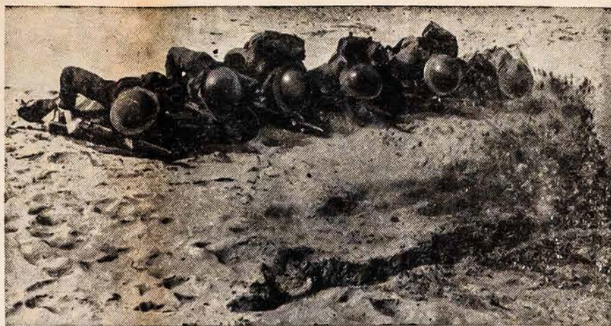
DIDŽIOSIOS BRITANIJOS NEPAFRAS TO NARSUMO COMMANDOS

Didžiosios Britanijos Commandos užstarnavo vardą kaip nepaprasto narsumo kareiviai, nebijanti jokio pavojaus. Jie savo narsumą rodo šitoj fotografijoje, laike lavinimosi Anglijoj. Čia jie traukiasi pirmyn prieš kulkosvydžio ugnį. Tėmykite vagą pakeltą šovinių, kurie išaria per smėlis arti šalmuotų vyrų galvų.