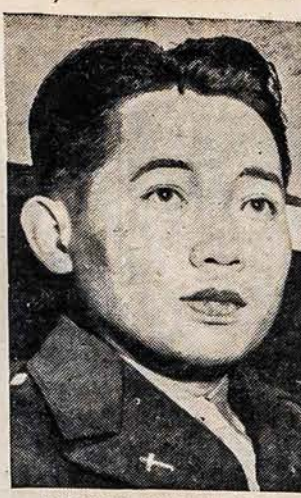
PABĖGO SU QUEZON

REIKALINGAS patyręs darbininkas prie abelo spaudos darbo. Rašykite: Amer. Lietuvis, 14 Vernon St., Worcester, Mass.