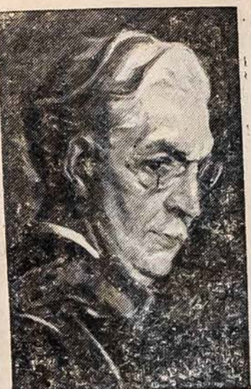
APDOVANOTAS AUKSINIŲ MEDALIŲ