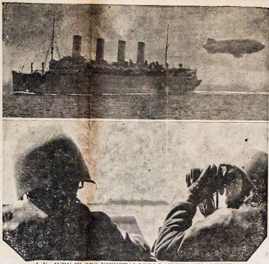
J. V. JURŲ IR ORO VIENETAI LYDI LAIVUS ATLANTIKE Vienas iš didžiausių laivų matyti per ankstyvo ryto miglas, kada jisai plaukė arčiau vienos iš mūsų karinės uostos. Laivyno balionas lydi laivą, gi karinis laivas (apačioje) tēmija ar priešas arti.

Išvadoje šių liudnų pasekmę gauname įspūdį, kad ši degeneracija, tai pasekmė blogu socialinių gyvenimo sąlygų, kurios viešpatavo mūsų krašte per eilę metų. Tokia padėtis nežada gerovės Amerikai, priešingai, žada pavojų Amerikos demokratijai. Todėl geistina, kad mūsų krašto vyriausybė, socialistinių ir mokslo įstaigų vadai rimtai susidomėtų ir dėty pastangas esamą padėtį pašalinti, kad rupintųsi auklėti piliečius kuniskai ir protiškai stiprius ir sudarytų sąlygas mūsų krašto demokratijai stiprėti ir kultūrinei pažangai bujoti.