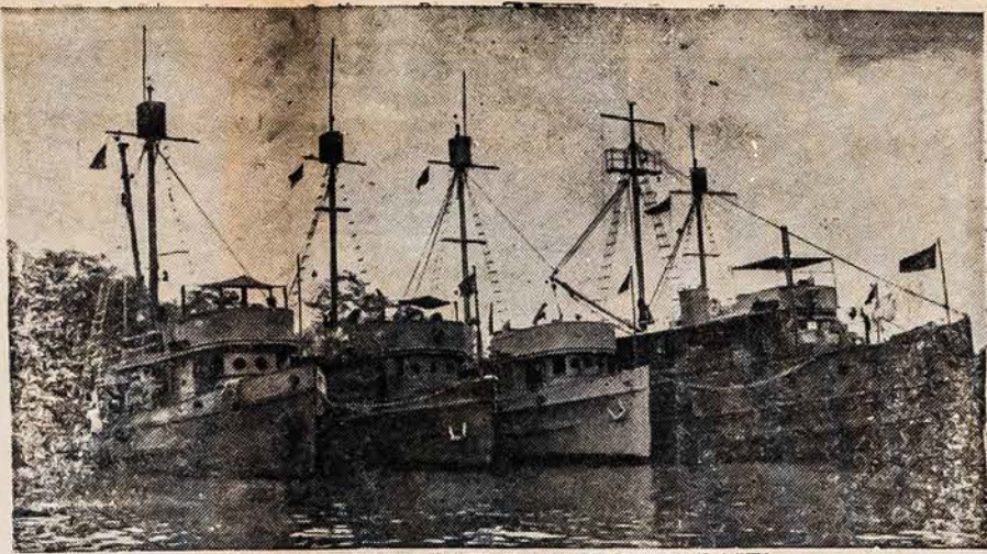
PADEDA APSAUGOTI VAKARINĮ PAKRASTĮ

Sie buvo žvejavimo ir kiti jurų laivai kaip tik prieš išplaukimą iš vakarinio pakraščio prieplaukos del apsaugojimo J. V. Pacifiko pakraštį. Šie mediniai laivai apsaugoja nuo ašies submarinų. Šie laivai nežvejos daugiau pakol J. V. karas tęsis.