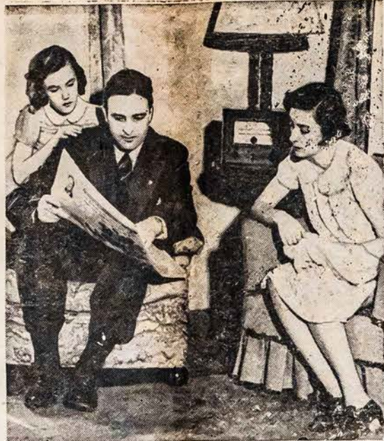
PIRMOJI SAVANORĖ Į MOTERŲ ARMIJĄ

tebėjimo dėl to, kad Želigovskis visą laiką buvęs neprietelingu nusistatymo Sovietų atžvilgiu. Ta proga laikraštis primena, kad Želigovskis "užgrobs Vilniaus kraštą, kuris turėjo tekti Lietuvai".