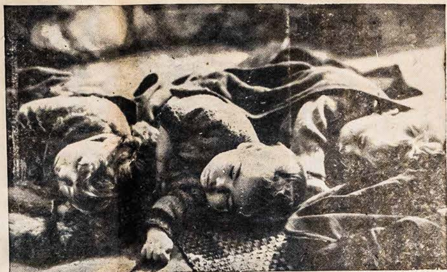
PAVARGE TREMTINIAI PRIEGLAUDOJE

Po ilgos vargingos kelionės iš vieno miestelio, va-karinės Australijos karo zonoje, šie vaikai užmigo ant grindų, viename priėmimo centre, Melbourne, Australijoje. Jie čia nebijo bombų, nes neseniai J. V. laivynas sumušė Japonus.