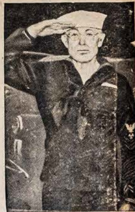
73 METU VETERANAS JUREIVIS

Amerikos Lietuvio Spaustuvėje Atlieka Visokius Spaudos Darbus Amerikos Lietuvis, 14 Vernon St.