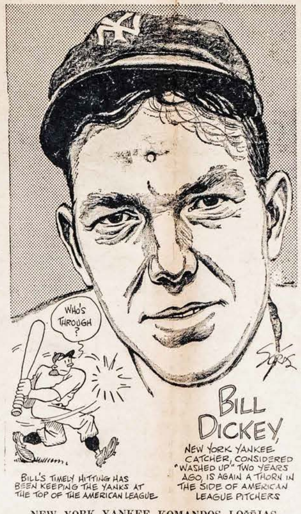
BILL'S TIMELY HITTING HAS BEEN KEEPING THE YANKS AT THE TOP OF THE AMERICAN LEAGUE.