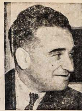
ISRADO KAIP DARYTI GUMA

VADOVAVO J. V. LAIVYNUI LAIKE DIDELIO MUSIO Vice-Admirolas, Herbert Fairfax Leary, vadovavo J. V. laivyno jėgoms laike didelio musio Pacifiko vandenyne. Jisai yra šaudymo ekspertas ir laike pirmojo didžiojo karo laimėjo Laivyno Kryžių. Jisai neseniai buvo paskirtas kaip piet-vakarų Pacifiko jurų jėgų vadas.