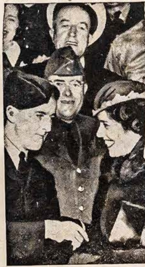
SVEIKINA AUSTRALIJOS LAKUNĄ

SKAITYKITE IR PLATINKITE AMERIKOS LIETUVI