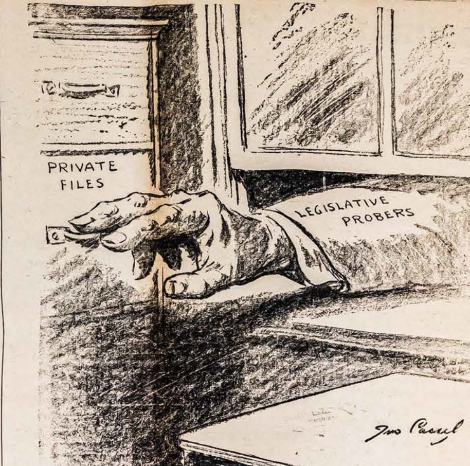
KA ŠITA RANKA NEGALI PASIEKTI?

Ši vasara bus sprendžiamųjų ir lemiamųjų karo kovų sezono. Aš esu linkęs manyti, kad šią vasarą Hitlerio smogikai žengs atgal o ne pirmyn visuose karo frontuose. Jo žadėtas žaibo karas neįmanomas, nes aplinkybės žaibo karui nepalankios. Nors Prez. Rooseveltas įspėjo mus, jog šis karas bus ilgas ir mūsų pareiga pasirengti ilgam karui, tačiau žvelgiant į karo eigą bei prospektivias suvienytų tau-