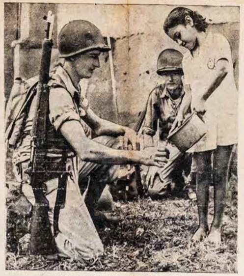
POILSIO LAIKAS PANAMOJE