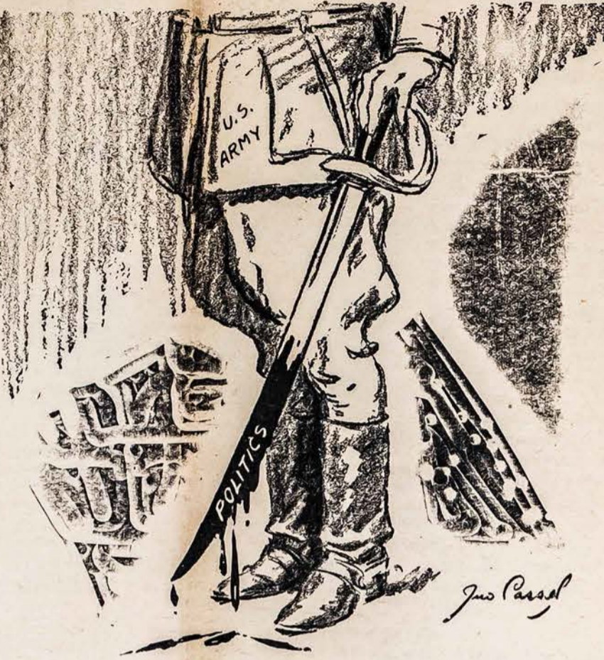
LAIKYKYTE GINKLĄ SVARIAI

realizavimu, nes šių reformų pravedimu politikoj gludi šansai išvystymui lietuvių su lenkais glaudžių santykių ir patikrinimas laimingesnės ateities Lietuvai ir Lenkijai ateityje. Mes esam šalininkai tokių reformų, nes mums atrodo, kad reališkesnės sąvokos nėra. Taipgi, mes žinom, kad pravedus šias reformas lenkai ir lietuviai galės atitaisyti politines klaidas savo prabodžių po Lublino unijos padarytas ligi šio karo ir galės atgauti visus kraštus, kurie lenkams ir lietuviams amžių teisėmis priklausio; žodžiu, bus gražinta anų