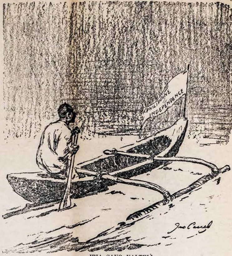
IRIA SAVO VALTELĮ

TUVI. Taipgi kartu nepamirškite, kad neužilio Amerikos Lietuvis piknikas—gegužynė, kur vėl sueisim ir linksmai laiką praleisim.