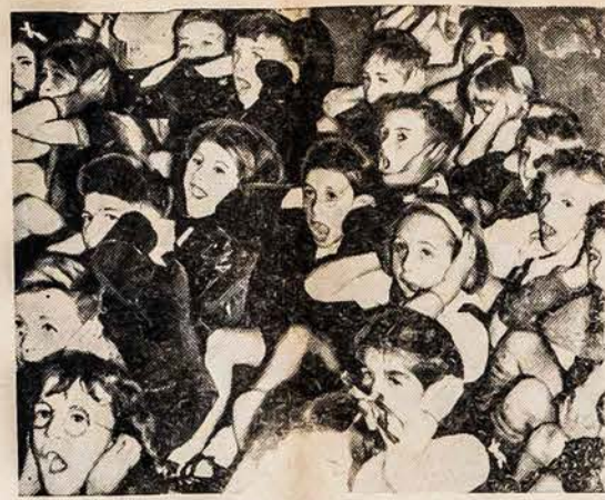
AUSTRALIJOS VAIKAI PRATINASI

Kitame to paties laikraščio numeryje randame tokią žinią: Didžiojoje Vytauto Didžiojo Universiteto Klinikose jau kuris laikas guli 23 lietuvių kariai, grįžę iš Rytų fronto. Palyginti jie mažai