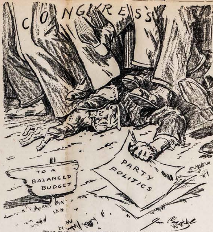
ŠTAI KAIP POLITIKIERIAI TREMPIA KONGRESĄ