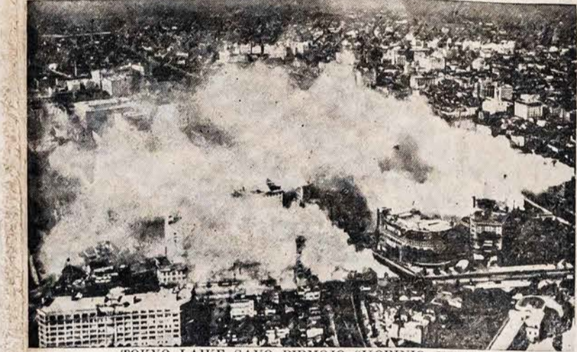
TOKYO LAIKE SAVO PIRMOJO "ISORINIO UZPUOLIMO." Šitas paveikslas nutrauktas iš lėktuvo virš Tokyo, rodo kaip miestas atrodė po to, kada japonai numėtė "bombas" laike išbandymu. Pagal pranešimus per japonų radio, šis vaizdas buvo atkartotas tikrenybėje, kada priešoj bombos užpuolė mi estą pirmą kartą, taipgi padarė daug nuostolių.

Čungking. — Lašio pateko į japonų rankas ir dega, gi Burma Kelias buvo atkirstas ties taja svarbia stotimi — Lašio, kuriš britai ir kiniečiai gynė, bet buvo suškaldyti priešoj pajėga. Kiniečiai pranešė apie tą nelaimingą Burma pietinės stoties paėmimą, kas reiškia viso kelio uždarymą. Kiniečių karininkai — vadai, pratęję kad naujos ir senos Lašio miesto dalys pateko priešams trečiadienį, po kruvino ir smarkaus susikirtimo. Jie pranešė taipgi, kad kiniečių kareiviai, vadovau-