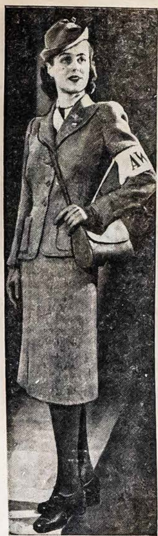
TINKAMAS KOSTIUMAS APGYNIMO DARBAMS

Vienas iš kostiumų, kurie buvo rodomi parodoje, New York'e, padarytas iš medžiagos, pato- giausios dėl karo laikų.