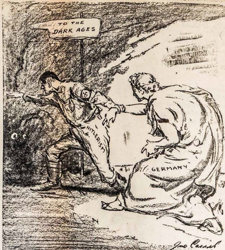
HITLERIS VEDA VOKIETIJĄ Į TAMSŲ AMŽIŲ GADYNE

Magaryčiom... atsirado tokių, kuriems atėjo mintis galvon, kad esą viską reikia užmiršti. Yra žioplta taip manyti, lig butų kokią mėšlyną palaikyti, kad ir ant toliau terštų atmosferą mūsų namuose arba tautos reikaluose. Svarbu mums surasti ir prašalinti tuos, kurie sudaro tą dvokiantį kvapą. Saugokime savo tautų nuo puvančių produktų. Tie, kurie neva "norėjo taikos" ir "išvengimo" visų sąvųjų begediškų darbų, nieko jiems nesakė ir dargi kurstė