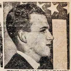
TESIA SAVO PROTĖVIŲ TRADICIJĄ