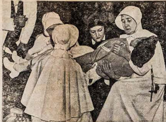
NEW YORKO VIENUOLĖS RUOSIASI KARUI Labdarybės Seserys, kurios veda šv. Vincento Ligonių New Yorko mieste, pradėjo kursą mokyti pirmosios pagalbos. Kursas bus per dešimtį savaičių. Trys iš seserų kelia "sužeiztąją" nuo žemės

Po gražaus prologo buvo vaidinimas komedijos, ant galo koncertinė programa dalis is dainų ir duetų; koncertinė programa dalį gražiai išpildė New Britaino SLA mokyklos mokinių mergaičių choras. Musų choristės harmoningai, gražiai dainuoja, gerai išsilavinę, publika gerėjosi jųjū meniškais gabumais.