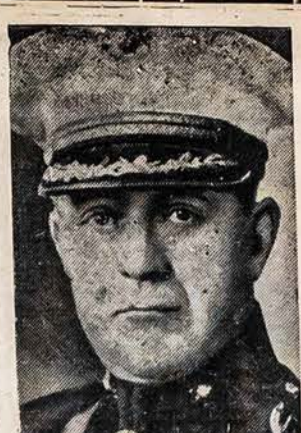
JUREIVIŲ VYRIAUSIAS VADAS Thomas Holcomb, buvo paskir- tas leitenantu generolu ir tuomi tapo J. V. Laiivyno Korpuso va- das, su aukščiausiais laipsniais.

se, kurios randasi arti Vasaros laike, (nors vasa- ros tikroje to žodžio pras- mėje, ten taip kaip ir nebu- na!), laplandiečiai gyvena maitydamiesi varškė ir nuo varškės išspaustomis išru- gomis, kuomet surius, veik išimtinai palieka žiemos maistui. Laplandietės mote- rys, visiškai nebedaro svi- to; gi finietės, — jau daro ir briedžių pieno sviestą, kurs yra labai šviesios spal- vos, — veik visiškai baltas!