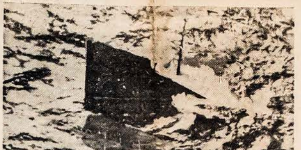
SUBMARINO AUKOS PASKUTINĖS MINUTĖS Šioji fotografija rodo 6,768 tonų tanką "Coimbra" slenkantį po vandeniu, kada submarinas pasiuntė torpedas, netoli New Yorko pakraščio. Šis laivas nešiojosi Sąjungininkės šalies vėliava.