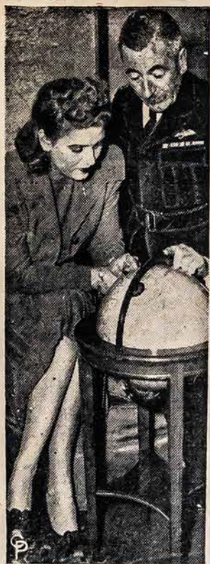
ORGANIZUOJA MOTERES LAKUNES

Užmuštų karininkų ir kareivių per ataką ant Perly Uosto gruodžio 7 d. buvo 2,340 ir sužeistų 946. Iš visų buvusių laivų Perly Uoste — karo laivų, sunkių kruizerių, lengvų kruizerių, lėktuvų, naikintuvų ir povandeninių laivų — tikrai trys visiškai sunaikinti. Daugelis Pacifiko Laivyno laivų net nebuvo Perly Uoste. Keli iš jų mažai užgauti; ir kiti, kurie buvo užgauti, aptaisyti, ir grąžinti prie Laivyno arba vis taisomi.