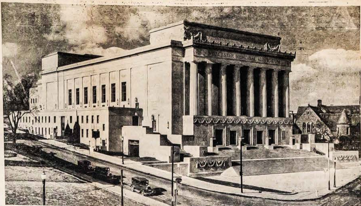
WORCESTERIO Miesto Memorial Auditorium

"Tiktai darbuose prie konfidenciališkų kontraktų darbdaviai įstatymu reikalaujami gauti leidimą pasamdyti ateivius. Ir peržiūrėjimas tų leidimų parodo, kad tik mažas nuosimtis buvo atsakyti."