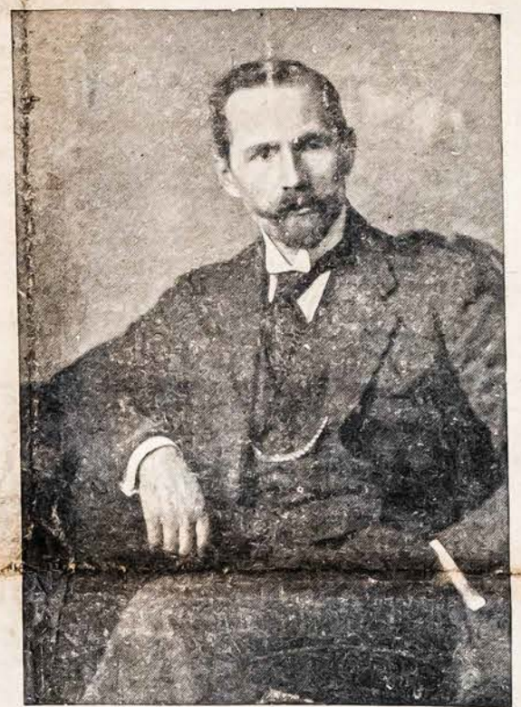
LIETUVOS PREZIDENTAS ANTANAS SMETONA Aplankys Worcesterį Kovo — March 1-ąją dieną, 1942 m. ir Kalbės Worcesterio Miesto Auditorijume kaip 2:30 p. p.

Visi kaip vienas susikaupkime, sueikime į miesto auditoriją ir išgirskime Lietuvos Prezidento istoriškos svarbos kalbą Lietuvos vadavim reikalais. Nepamirškim jog šis Lietuvos Prez. Smetonos atvykimas į mūsų koloniją turi svarbią istorišką reikšmę ne tiktai Lietuvai, bet ir mūsų lietuviškai kolonijai. Tatai vertindami šį istorišką momentą—proga Prez. Antano Smetonos vizito, pasirodykim sąmoningais ir vieningais, ištikimais senosios Tėvynės Lietuvos sunais ir dukterimis. Prisiminkime anuos dramatiškus įvykius mūsų tautininkavimo Lietuvai laikais—1917-1920 metus, eikime keliais mūsų Tautos vado Antano Smetonos, Dr. Jono Basanavičiaus mums nurodytais, stokim kaip muro siena Lietuvos vadavimo fronte. Visi, senieji ir jaunieji dalyvaukime Prezidento Sme-