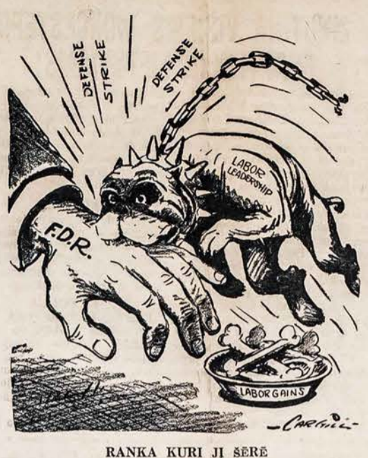
RANKA KURI JĮ ŠERĖ

širdis ir protas atrodo lyg y- ra tarytum užžėlęs kokiais medžiais, tamsia, nepereina- ma džungle, per kurią ne- pajėgia prasimušt tautinio susipratimo saulės šviesos spinduliai, ir per tai neduo- da jai suprast, pamatyt, kad reikia remt ir palaikyt švie- seniąją savo tautos dalį profesionalus ir biznierių. Tose tamsiose mus visuome- nės proto ir širdies džunglė- sė veisiasi plėšrūs pavydo tigrai, kurie drasko ir silp- nina mus mažos, negalingos tautos kuno pajėgas. Jeigu mus profesionalai ir biznierių pasitaisę, pasi- aštrinę savo protinius kirvu- sus, pradėtų tą mus visu- menės širdies ir proto džun- gles kirsti, retinti, tada be- abejonės išnyktų tie plėšrūs pavydo tigrai. Tautinio susi-