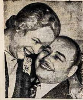
JŲ SUNUS GYVAS

Naujas Philadelphia Phillies vedėjas 1942 sezonui yra John (Hans) Lobert, 60 metų. Jisai yra veteranas lošėjas ir buvęs National League beisbolo mokytojas. Connie Mack yra seniausias didelių lygų vedėjas, gi Lobert yra antras iš eilės senumo.