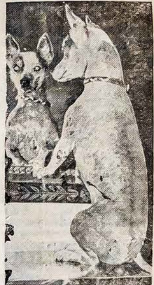
ŽIURĖK — ČAMPIJONAS!

Dar kartą žiuri į save čampiononas Chinoto, Jr., Meksikietis veislės šunukas, kurs laimėjo pirmą dovaną devintame metiniame Zaislinių Šunų parodoje, New Yorke.