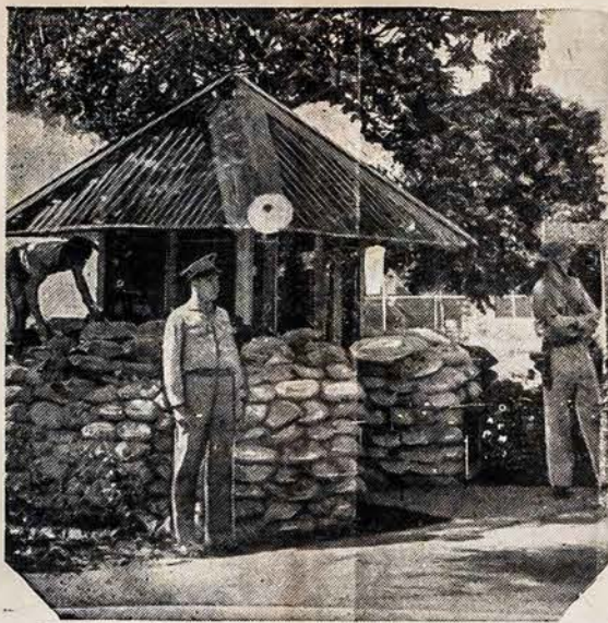
PANAMA RUOSIASI DEL GALIMŲ UZPUOLIMŲ

AMERIKOS UKININKŲ BIZNISO GERAS Washingtonas, Sausio 5. — 1941 metais Amerikos fermeriai pardavė už $11,600,000,000. Tai yra didžiausias fermerių bižnis nuo 1920 metų.