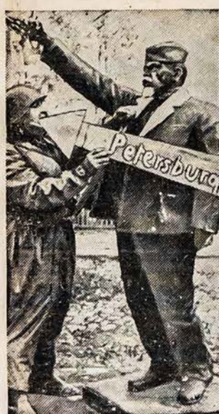
Vokiečių kareiviai nukėlė Stali- no statulą nuo aukštos stovy- los, idant Stalinas rodytų mar- šuojančiams vokiečiams kelią į Leningradą, sako Berlyno užgir- ta žinia, kuri atėjo sykiu su šia fotografija.

Kodėl mes turim, kaip maži vaikai drebėti ir teisinti, kad mes mokam valstybę tvarkyti ir turim teisę savo mažą valstybę Nepriklausomą turėti. Jie ži- no, kad mes mokam. Jie žino, kad mes mokėjom netik mažutę, bet didelę imperiją tvarkyti. Delto ir ne delko kito jie ir puo- liai Lietuvą. Jų gyslose tebeteka lietuvių galios baimės kraujas. Buti nekaltais avinėliais vilkų pasauly negalima. Lietuviai tu- ri griežtai pareikšti savo pre- tenzijas Vytauto Lietuvą, Vy-