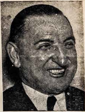
PHILADELPHIA KOMANDOS VEDĖJAS

— Per Kauno radiją buvo perskaitytas laikraščio "I Laisvę" straipsnis "Jie gyvena" — žiupsnelis minčių, ryšium su Vėlinių tradicijomis. Straipsnyje nuro-