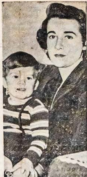
MIRUSIO DIDVYRIO ŽMONA IR SUNUS

Šis paveikslas rodo prezidentą Fulgencio Batistą pasirašantį įstatymą, išleista Kubos Kongresą, padėdamas Kubą į karą prieš Japoniją, kaip Jungtinių Valstijų aliantas.