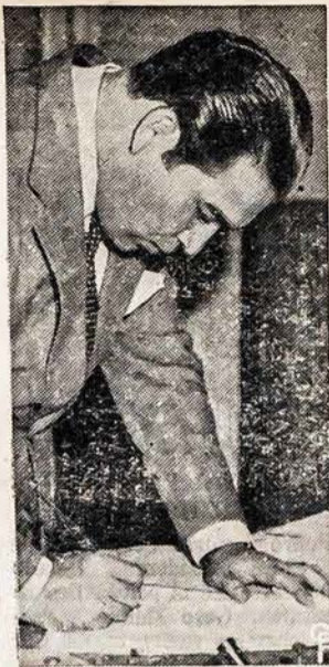
IRASĖ KUBĄ Į KARĄ

„Mes esame įsitikinę, kad praktiškai, Lietuva, kaip ir visos kitos tautos, turės teisę dalyvauti pasauliniame kare, kuris bus laimingas, jei tik mes sugebėsime išvengti jo.“