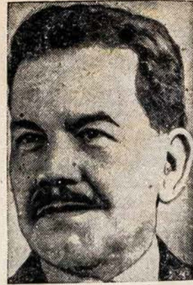
LIGLAIKINAI PASITRAUKĘS PREZIDENTAS

Britanijos laivyno ir orlaivninkystės viršininkai, Sir Dudley Pound (kairėje) ir Sir Charles Portal, Washington žiūro į žemėlapi, studijuodami planus del J. V. ir Britanijos bendradarbiavimą kare prieš ašį.