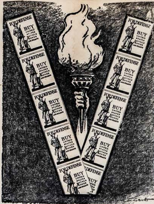
For Victory — Už Pergalę