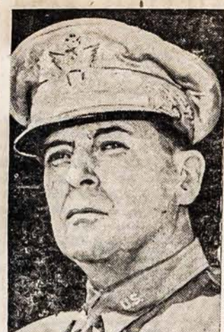
GENEROLAS DOUGLAS MacARTHUR