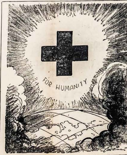
"UŽ GARBINGĄ PASIŽYMĖJIMĄ TARNYSTOJE DEL ŽMONIJOS KRYŽIAUS"