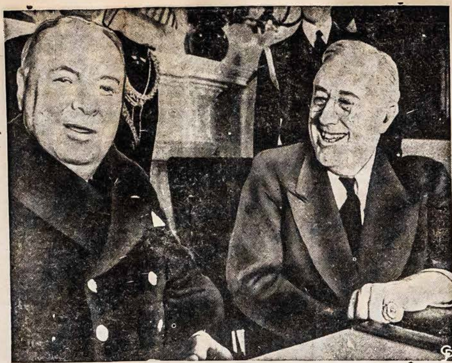
PLANUOJA BENDRĄ SAJUNGIEČIŲ STRATEGIJĄ, BALTUOSE NAMUOSE Didžiosios Britanijos Premieras Winston Churchill ir Prezidentas Rooseveltas atrodo esą gerame upe, kada susitiko Baltuose Namuose. Judviejų pasitarimuose bus įsteigta bendra visų sąjungiečių veikiamoji taryba.

Bet Hitleris ir nacių partijos vadai nenorėjo, idant vokiečių karinė mašina rudytu po nugalėjimo Prancuzijos po išvijimo anglių iš Grekijos. Jiems buvo baisu žiūrėti į nieko neveikiančią vokiečių kariuomenę, jie m s rupėjo paleisti jų karinių jėgų mašiną į rytus, išnaudoti momentą vokiečių civilių ir karių pergalių psichologinį momentą. Hitleris iš lovos guldamas ir keldamas galvoje apie turtingąją Ukrainą kur dideli kviečiai auga, kur cukrinių runkelių, gražūs sodai, anglies, naftos ir geležies rudos klotai randasi. Ukrainos didieji turantai viliojo Hitlerį, jis miegodamas sapnuodavo Ukrainą, jis ir jo pasekėjai žiūrėjo į Baltijos kraštus kaip turtingus daržus, virtuvės lentynas kupinas maisto ir kitokių gėrybių. Tada Hitleris nenorėjo ilgai laukti į Prusijos pasienį bestiprejančius raudonarmiečius, statančius tvirtoves ir besirengiančius pulki Vokietiją. Todėl jis pradėjo karą peraitame birželio mėnesį rytų fronte.