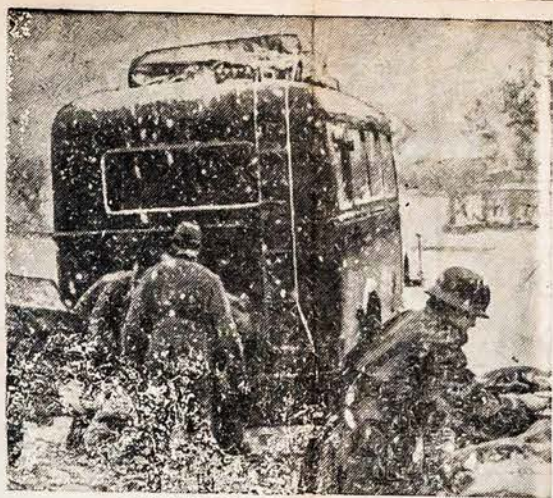
NACIAI SULAIKYTI RUSIJOJE Šita fotografija iš Vokietijos rodo kaip Vokietijos motorizuotos kariuomenės vienutės sulaukimos sniego Rytiniame Fronte. Ne tik tai garbingos nacių panzers yra sulaukytos tame fronte, bet ir iš Krymo jau rusai veža vokiečius laukan.