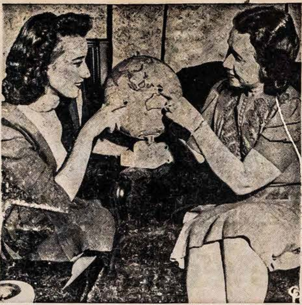
DIDVYRIO MOTINA IR SESUO