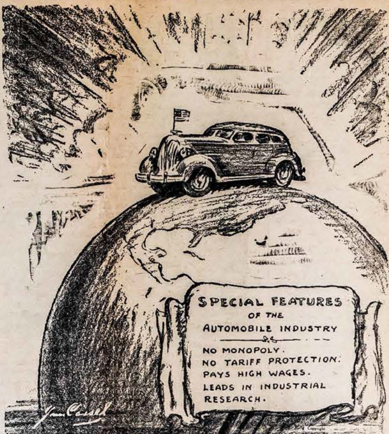
NAUJAS AUTOMOBILIAUS MODELIS