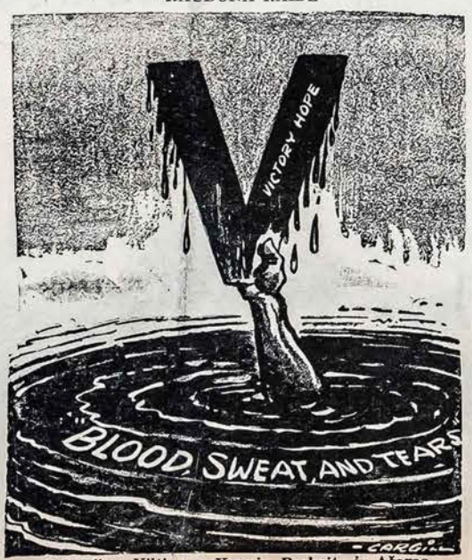
Laimėjimo Viltis per Kraują, Prakaitą ir Ašaras