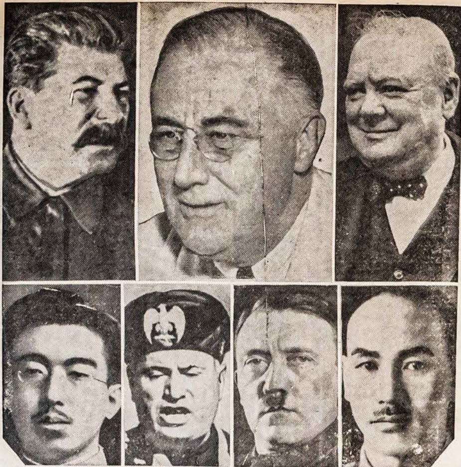
BEKARIAUJANČIŲ DIDŽIAUSIŲ PASAULY TAUTŲ VADAI

Laimingų Naujų Metų Visiems Amerikos Lietuvos skaitytojams. Am. Lietuvio Red.