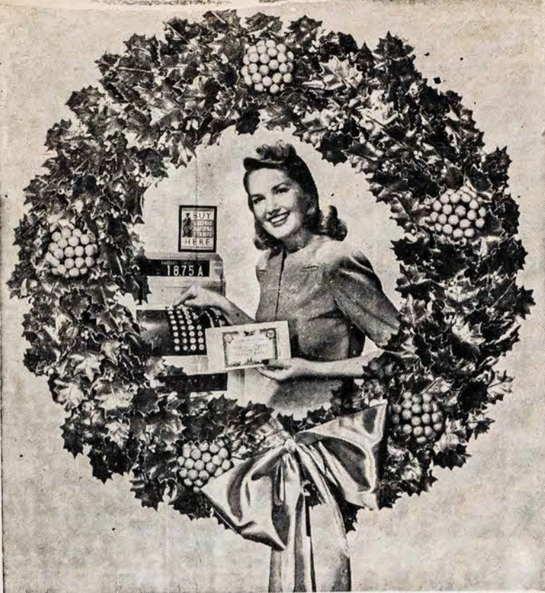
MERGINA, KURI PARDAVINĖJA APSIGYVIMO KRASAŽENKLIUS IR BONDSUS DEL KALĖDINIŲ DOVANŲ.

Visųpirmu už to Vardo slepiasi galinga, žmogaus protu neapimama nesuprantama jėga. Žmonės gema, pagyvena savo laiką, miršta ir lieka pamiršti. Visokios socijalių reformų teorijos iškyla, dėl kurių žmonės ginčijasi, barasi, iškelia žiaurias, kruvinas revoliucijas, karus, kuriem pasibaigus pasilieka tik kruvini pėsakai. Po to žmonės vėl atsistato sugriautus namus, susitvarko ir vėl sau gyvena, viską pamiršta, tarytum nieko tokio svarbaus nebutų įvykę. Pavyzdin dabartiniu laiku karo audra beveik jau yra apėmus visus pasaulio kampus. Laikraščiai kasdien, o radio bangos kas minutą praneša naujlenas kiek kur užmušta žmonių, nu-