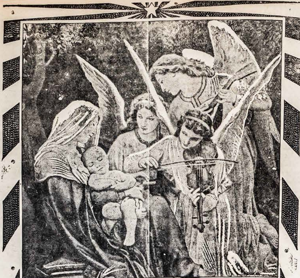
"SVEIKAS JĖZAU, MAZIAUSIS..."