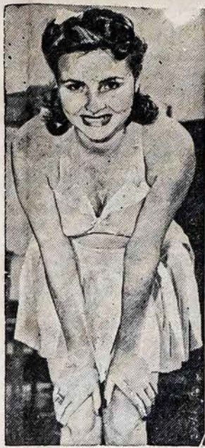
NORI BUTI "PONIA AMERIKA"

Viens iš 200 ar daugiau ištekejusių moterų, kurios dalyvaus ketvirtame "Ponia Amerika" gražuolių konteste, Palisades Park, N. J. Kontesto tikslas yra įrodyti, jog ištekejusios moterys yra tiek gražios kaip ir merginos.