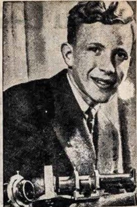
PENKIOLIKOS METŲ MOKSLININKAS

Į visa tai atsižvelgiant, šiuomi mes kreipiamėsi į savo Skyrus ir visus kolonijų veikėjus, ir prašome, aukaujamus drabužius ne krauti vienon vieton, bet palaikyti juos iki pareikalavimui, kada bus galima išsiūsti. Kas tokius drabužius aukauja, lai juos palaiko pas save, kol reikalams susitvarkius, mes pranešime ir nurodysime vietas, į kurias galima tuos drabužius priduoti. Veikėjai, kurie drabužių rinkimu rūpinasi, šiuomi prašomi kiek galima surinkti tik vardus aukautojų, ir juos turėti savo žinioje iki laikui, paprašius kad aukautojai drabužius palaikytų pas save, kol bus galima juos paimiti siuntimui. Kada ir kaip greitai bus tai galima, prie dabartinių aplinkybių