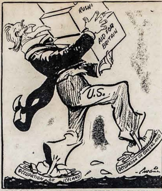
DEDE SAMAS SKUBI SU PAGELBA BRITANIJAI

kutinis ŠIAURĖS ŠVIESŲ pasirodymas ypatingai bus naudingas mokslui, kas lie-