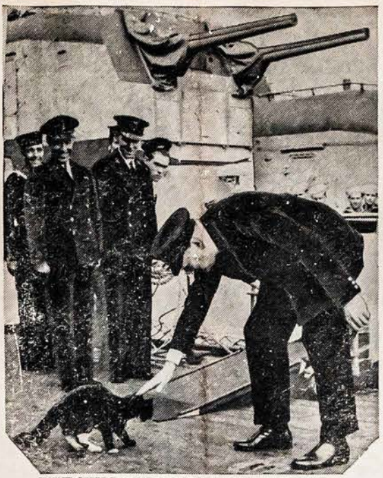
CHURCHILL PRISIVILIOJA NAUJĄ DRAUGĄ Britų Premieras, Winston Churchill, gryždamas Anglijon po konferencijos su prezidentu Roosevelt, pasivaikščioldamas ant laivo "Valijos Prince" sustojo paglostyti laivo katina "Blackie".

Daugelis lietuvių jaunimo lankančio aukštesnes mokyklas Mass. valstijoje turės progą mokytis tėvų kalbos. Todėl lietuviai ir lietuvaitei, nuėję į universitetą ar akademią, galės kitus mokytis lietuviškos kalbos, arba, pasirengusieji į mokytojų