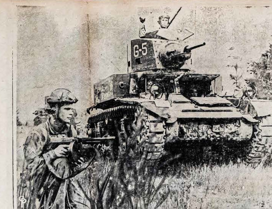
MANEVRAI, LOUISIANA VALSTIJOJ J. V. kareiviai išbando mekanizuotą kariavimą laike manevrų, prie Polk kareivinių, Louisiana valst.