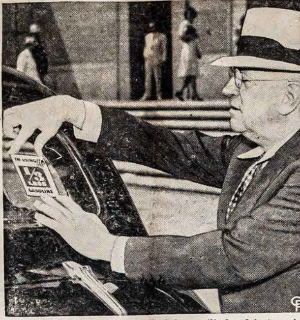
Vidaus Sekretorius Harold L. Ickes prilipo plakata pri savo automobilio Washingtono. Plakate atspausdinta "Aš naudoju 1/2 mažiau gasolino". Automobilij vairuotojai rytinėse valstijose, kurie prižada taupyti gasoliną, gaus šitokį plakata del savo karų. Gasolino stotys nuo Maine iki Florida platins šiuos plakatus.