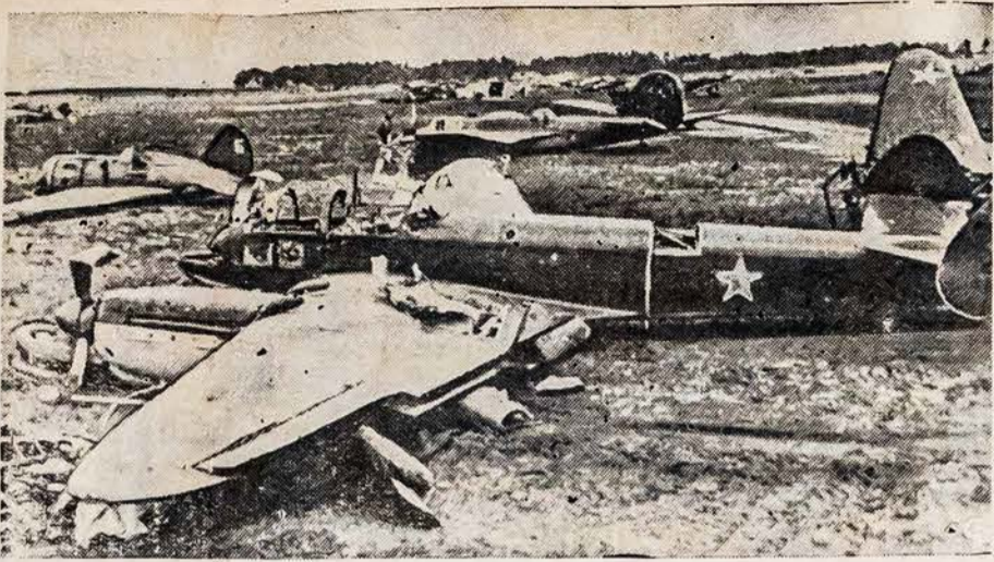
NACIAI SUDAUZĖ BOLŠEVIKŲ LEKTUVUS Hitlerio Luftwaffe kariniai orlaiviai užtikro sovietų lėktuvus aerodromoje ir paleido bombas į juos. Tuo metu, sovietų oro mašinos buvo sunaikintos pirmą negu galėjo pakilti. Šis paveikslas buvo nutrauktas, po to, kada nacių pulkai okupavo tą kraštą. Panašūs įvykiai atsitiko su sovietų lėktuvais ir Lietuvos aerodromuose.

17. Pamažu ima aušti rytas. Pro rykus, prō debesis veržiasi dienos šviesa. Prie kiekvienos gat-