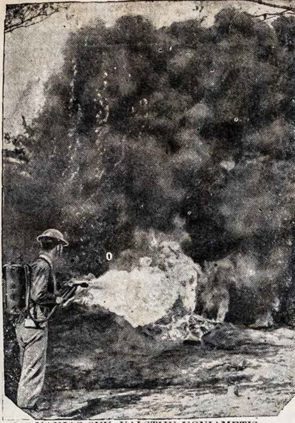
NAUJAS SUV. VALSTIJŲ UGNIAMETIS