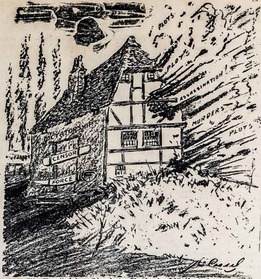
Iš Prysakio žiurint Rodosi Užtikrinimas

Vokiečiai neva leido gaudus vienokius ir kitokius apie Lietuvos nepriklausomybės atsteigimą, pamatė, kad po Hitlerio globa, tas nėra galima. Aišku, kad iki karo pabaigos, mes mažai tos nepriklausomybės jausime iš po Hitlerio jungo. Lietuvos nepriklausomybė yra ateities klausimas, ji priklausys nuo jai lemiančių aplinkybių laisvai butų, tarpe kitų pasaulių gyvuojančių laisvų tautų.