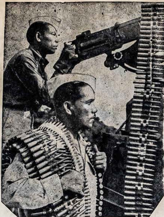
PHILIPPINAI SUV. VALSTIJŲ KARINĖJ TARNYBOJE Philippinų skautai rodo kaip jie naudoja sunkaus kalibero kulkasvaidį laike savo salos manevrų. Visa Philippinų kariuomenė įjungė ir Suv. Valstijų kariuomenę ten pasiūtą sulig Prezidento Rooseveltto įsakymo. Šis Prezidento įsakymas buvo kaip atsakymas japonams del jų Indo-Kinijos okupacijos, kuri stovi 700 mylių atstumeje nuo Philippinų.

— Tik, brolyčiai, nesigailėkite jų budelių, judoši... Jie ir jums dar kelią gali pastoti.