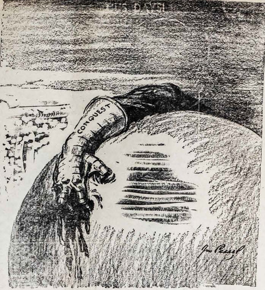
Tai "Pavojinga Ambicija"

Lošime dalyvauja 3 asmenys — Tadas, Aldona ir Vytautas. Ši komedija labai populiari, juokinga ir lengva sulošti. Atspausdinta 1941 metais. Kaina su pristuntimu 20 CENTŲ AMERIKOS LIETUVIS 14 Vernon St. — Worcester, Mass.