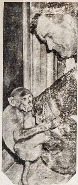
PASPRUKO NUO POLICIANTŲ