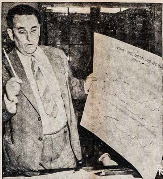
JO SAIKAS VADINAMAS "SOCIALISTINIŲ"