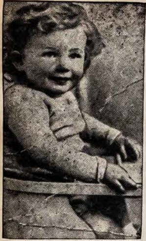
NEŽINOMAS VAIKUTIS Šioji fotografija buvo gražios moteriškės rankoje, jai mirštant, kada klubas buvo subombarduotas Londone.