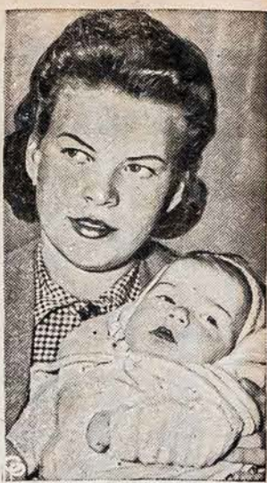
GIMĖ TREMTINIS Šitas vaikutis būtų turėjęs gimimo metrikus Amerikoje, jeigu daugiau laivų plauktų iš Lisabono į Jungtines Valstijas.